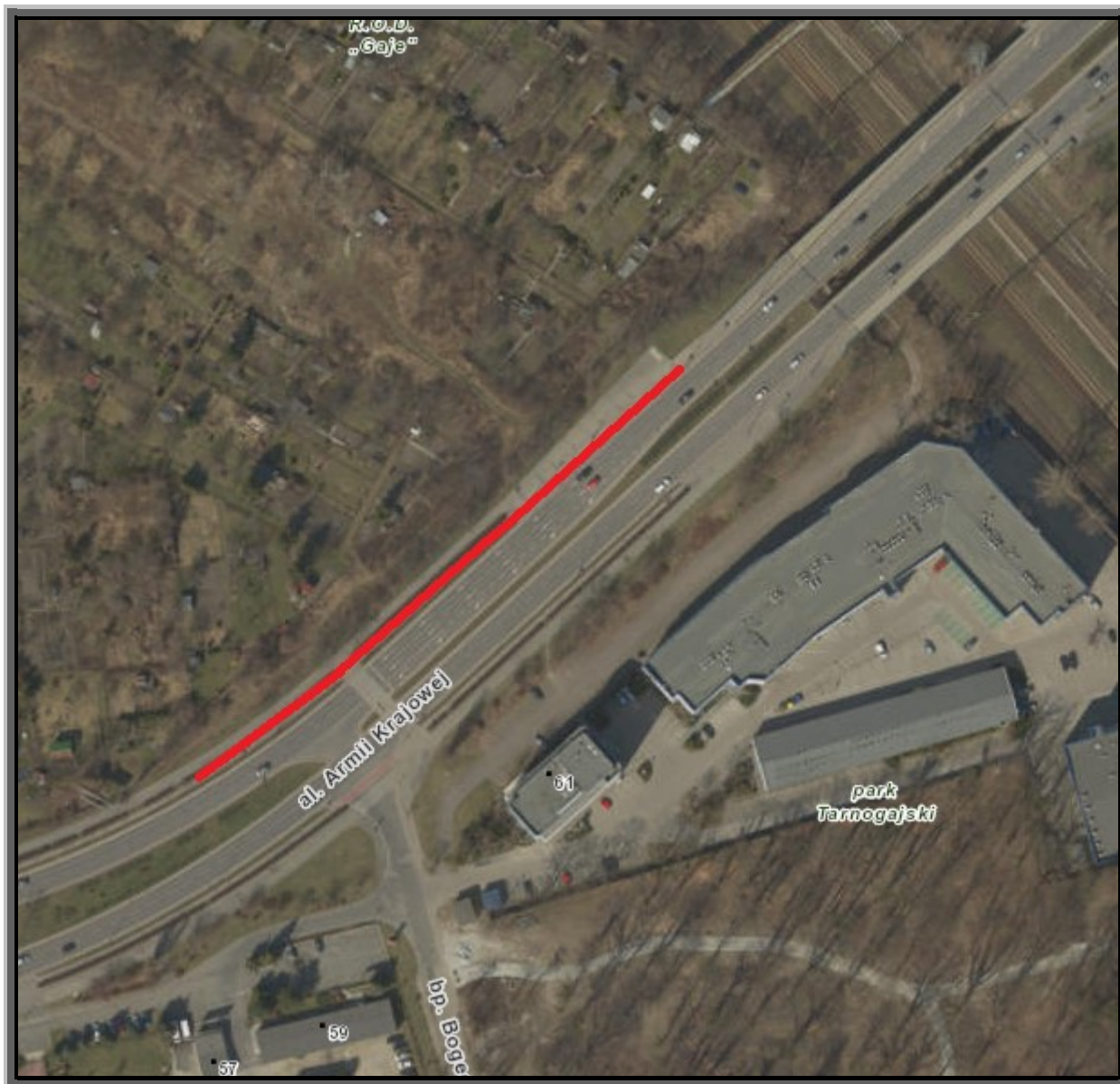
Rys. 1 Plan orientacyjny – zakres inwestycji

które stanowią załącznik nr 2 do niniejszego OPZ.