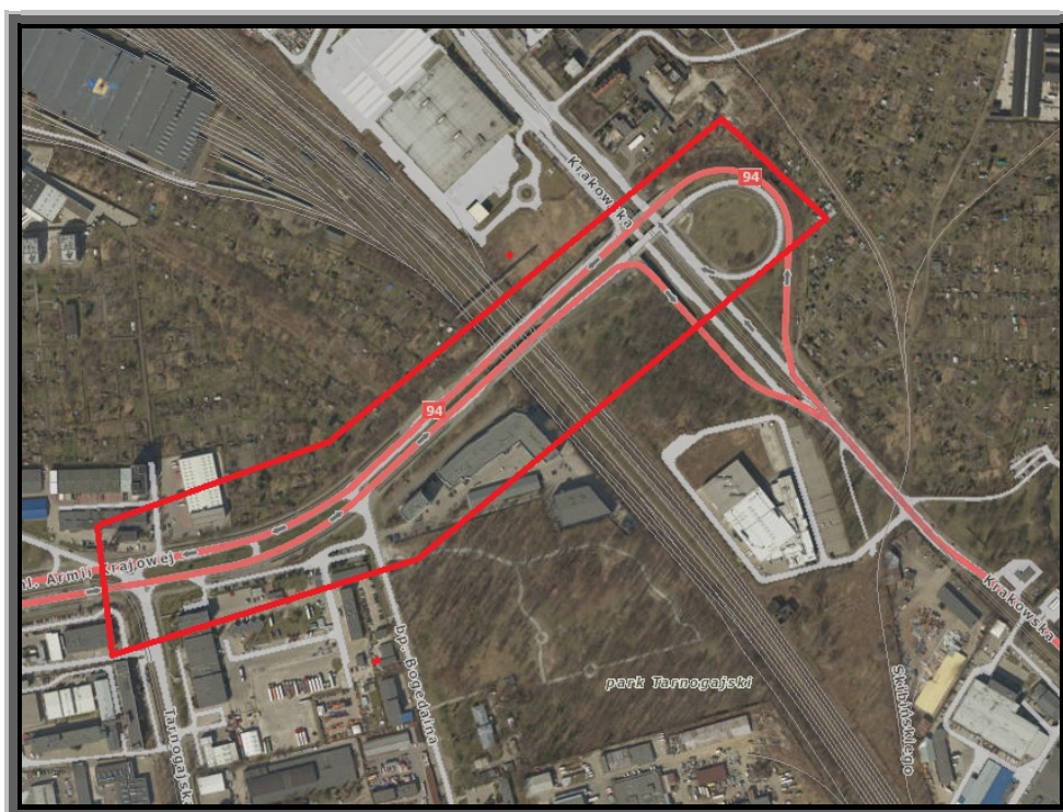
Zakres zamówień podobnych

Realizacja zadania obejmuje wykonanie dokumentacji projektowej wraz z decyzjami administracyjnymi oraz roboty budowlane: