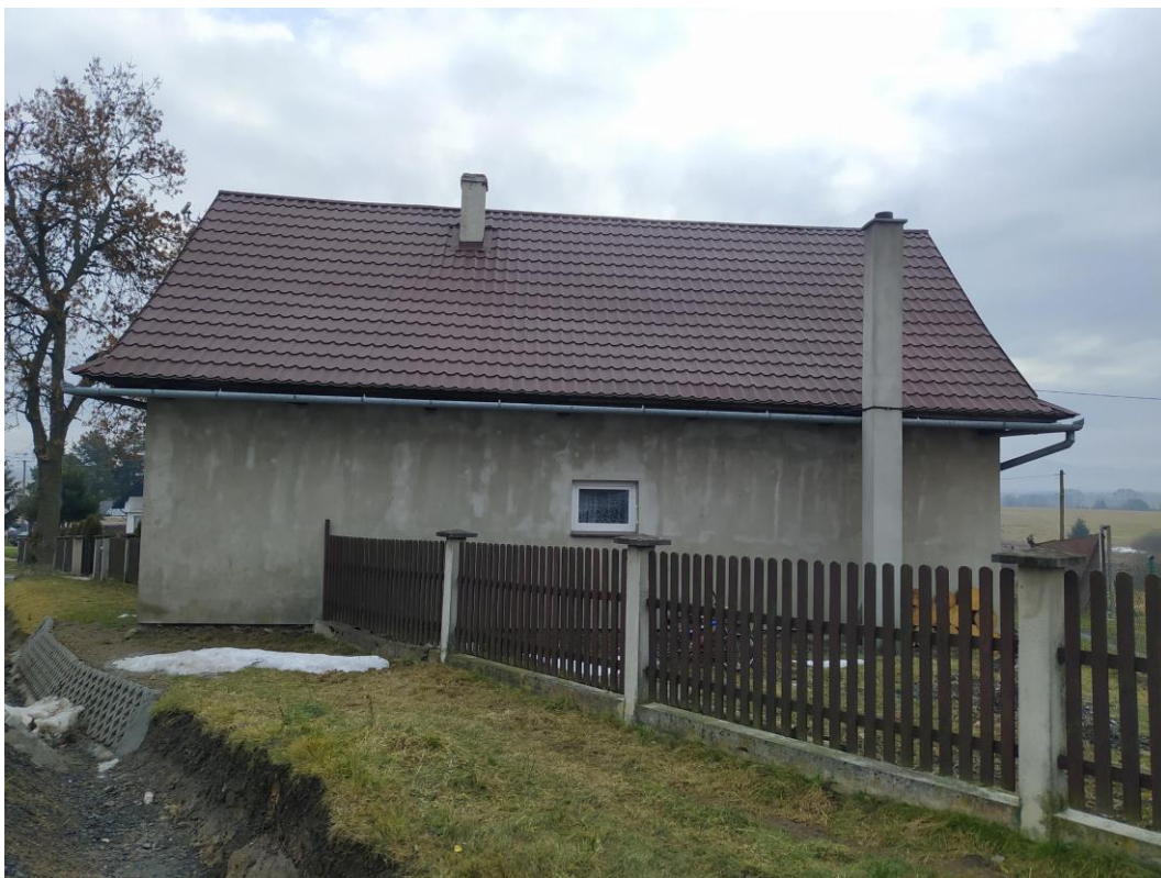
widok od strony N