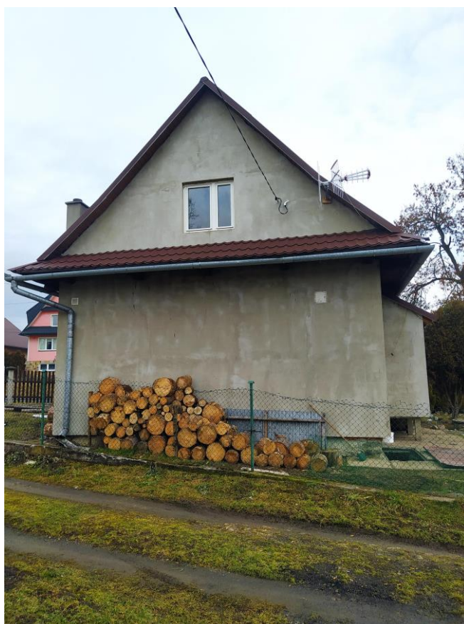
widok od strony W