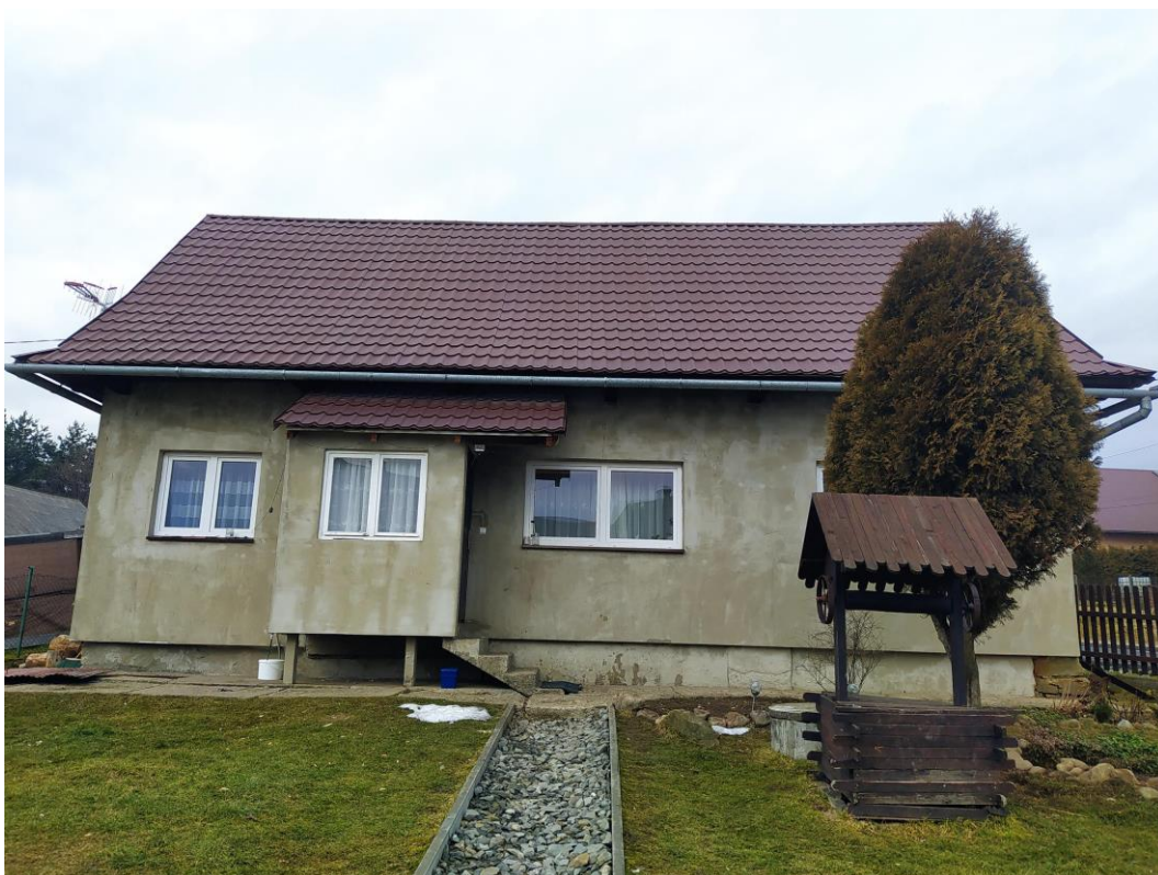
widok od strony S