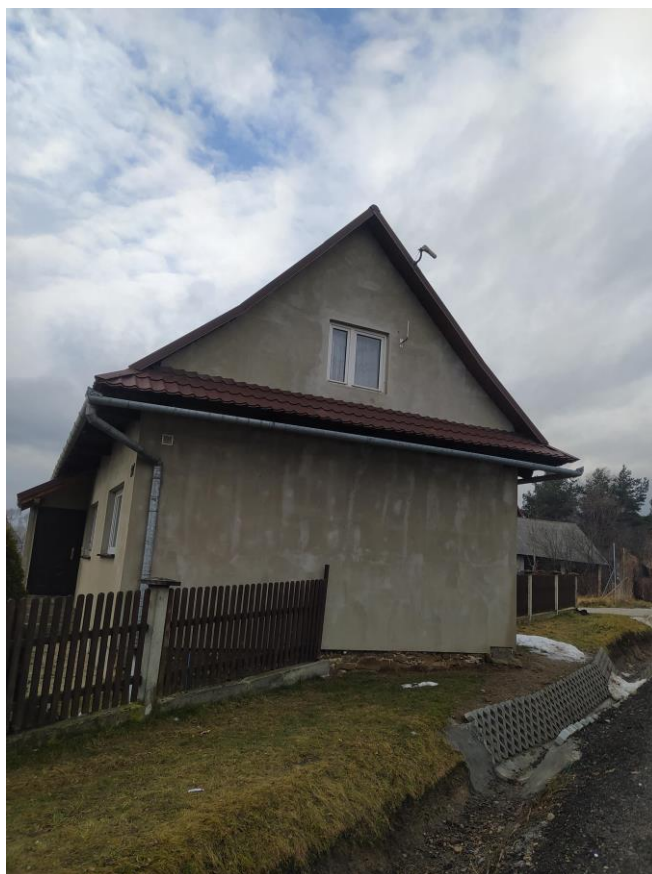
widok od strony E