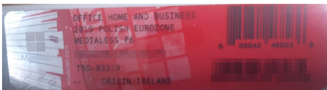
Rys. 2 przykładowy kod zabezpieczony przez producenta systemu Microsoft Office Home&Business z wymazanym, znajdującym się w prawym dolnym rogu numerem seryjnym produktu. Kod licencyjny znajduje się w środku szczelnie zapakowanego i zafoliowanego pudełka (Rys. 3)