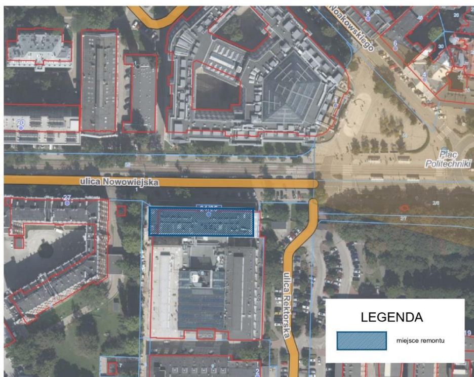
Lokalizacja miejsca remontu