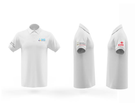
Rysunek nr 2. Poglądowa wizualizacja koszulka