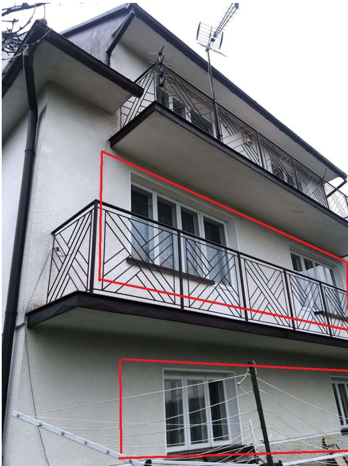
Rysunek 2 Zakres modernizacji - wymiana okien (elewacja południowo-wschodnia - 6 szt.)