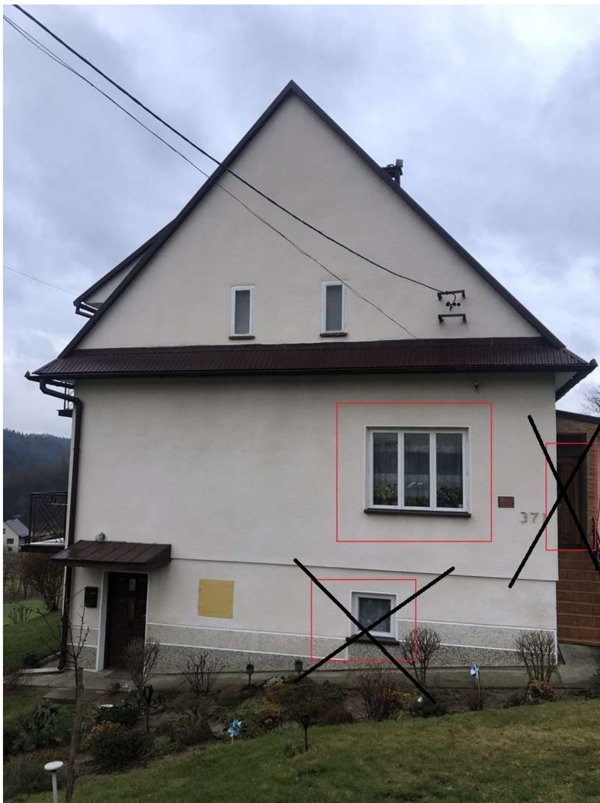
Rysunek 1 Zakres modernizacji - wymiana okien (elewacja południowo-wschodnia - 1 szt.)