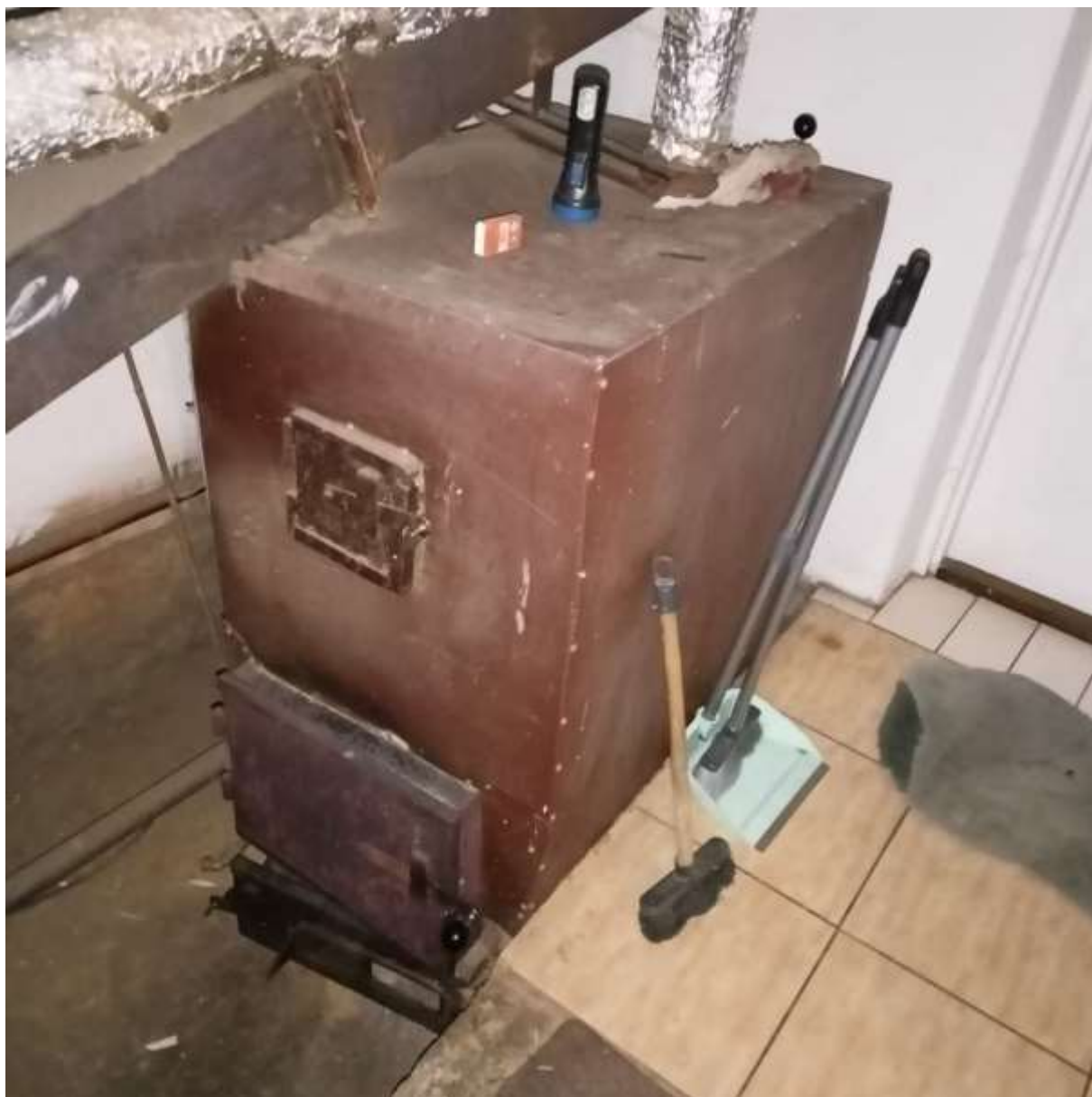
Rysunek 3 Zakres modernizacji - wymiana źródła ciepła wraz z modernizacją instalacji co i cwu