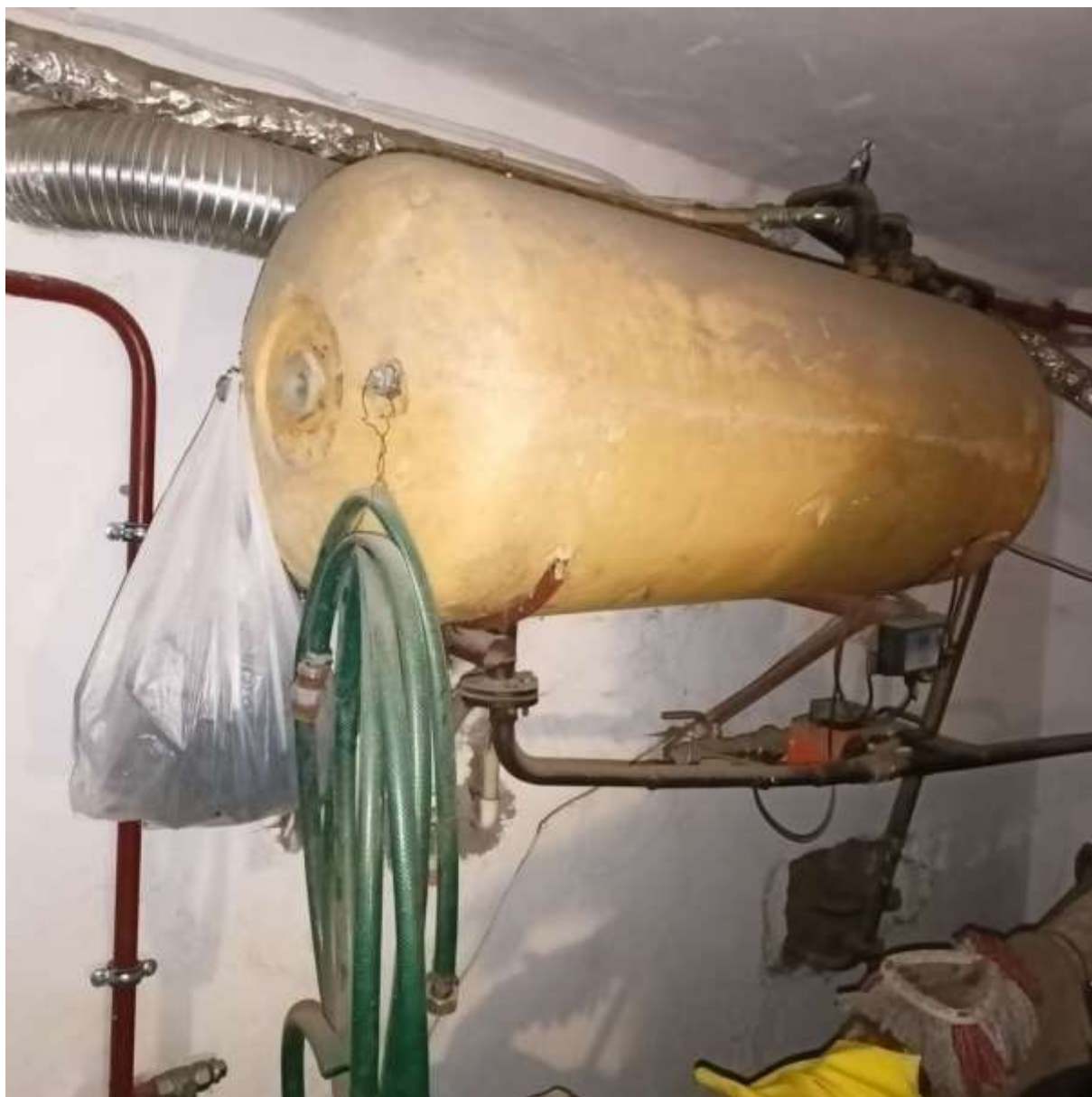
Rysunek 4 Zakres modernizacji - wymiana źródła ciepła wraz z modernizacją instalacji co i cwu