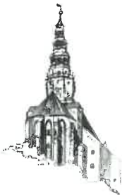
Kościół pw. Św. Stanisława i Św. Wacława Katedra Diecezji Świdnickiej

2. Budynek MOPS-u. Czy należy wykonać wyłącznie remont budowlano-konserwatorskie istniejącego zabytkowego witraża w auli, czy też (jest o tym