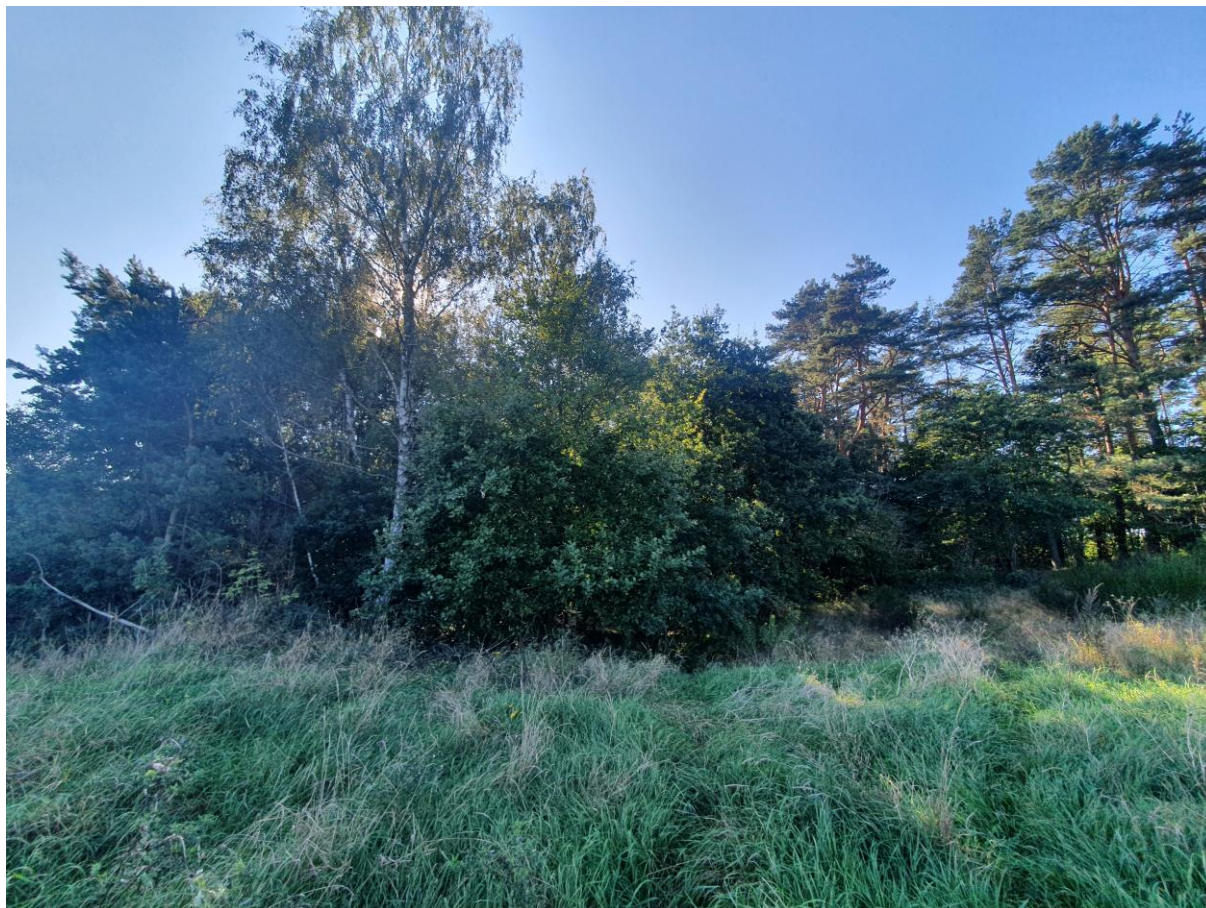
Ryc. 4 Widok na starodrzew w północno-wschodniej części działki nr 582.