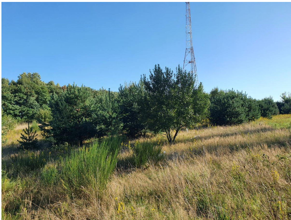
Ryc. 5 Widok ogólny w centralnej części działki nr 259/13

Większość powierzchni działki stanowi nieużytek oraz pojedynczo oraz kępowo występujące samosiewy sosny zwyczajnej oraz brzozy brodawkowatej. W trakcie prac zinwentaryzowano samosiewy, których obwód na wys. 5 cm przekraczał 50 cm i na których usunięcie wymagana jest decyzja. Na działce 259/13 zinwentaryzowano łącznie 117 pojedynczych drzew. Wyniki inwentaryzacji przedstawiono w tabeli nr 2. W południowej części działki wzdłuż drogi znajduje się skupia sztucznie nasadzonej brzozy brodawkowatej oraz robinii akacjowej. W skupinie zinwentaryzowano łącznie 164 egz. brzozy brodawkowatej o obwodach od 35 do 48 cm oraz 119 egz. Robinii akacjowej o obwodach od 36 do 45 cm.