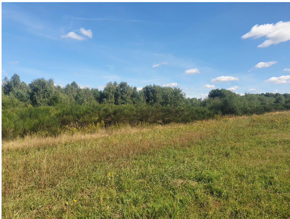
Ryc. 2 Widok na działkę nr 580.

Na działce we wschodniej części występują pojedyncze samosiewy sosny zwyczajnej oraz brzozy brodawkowatej o wys. do 3 metrów oraz obwodach na wys. 5cm nie przekraczającym 50 cm oraz płaty szczodrzenia miotlastego. Wobec czego nie zinwentaryzowano pojedynczych drzew. Przywrócenie gruntu do użytkowania rolniczego nie wymaga decyzji na usunięcie drzew.