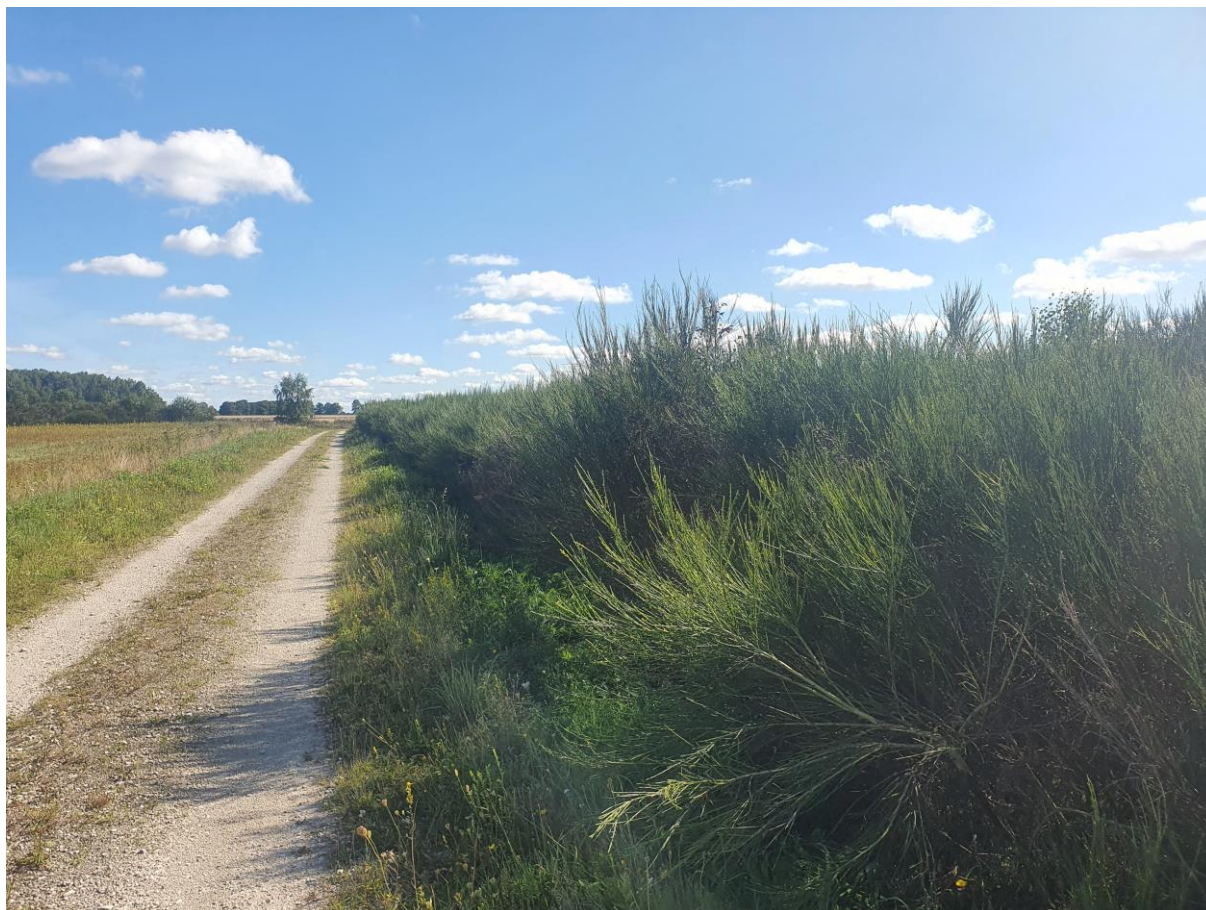
Ryc. 3 Widok na wschodnią część działki nr 582.

Większość powierzchni działki stanowią płaty szczodrzeńca miotlastego oraz pojedyncze samosiewy sosny zwyczajnej oraz brzozy brodawkowatej. W północno wschodniej części działki fragment starodrzewia z dominującym dębem szypułkowym oraz sosną zwyczajną. Na działce zinwentaryzowano 102 drzewa wymagające uzyskania decyzji na usunięcie. Wyniki inwentaryzacji przedstawiono w tabeli nr 1.