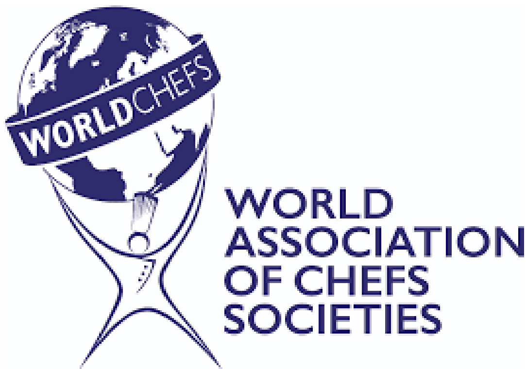
Fotografia 13 - Logo World Association Of Chefs Societies - fotografia pogładowa