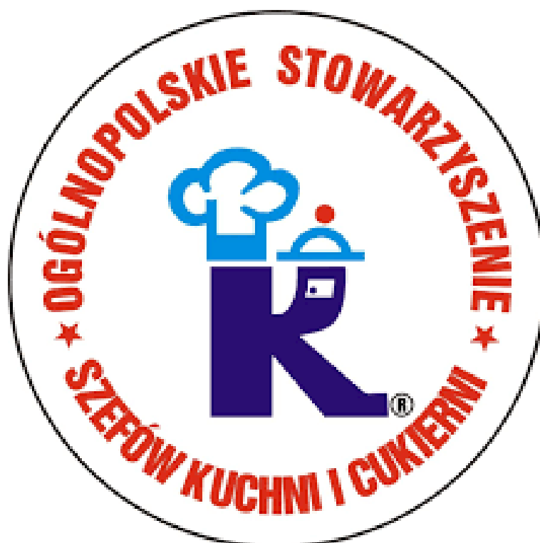
Fotografia 12 - Logo Ogólnopolskiego Stowarzyszenia Szefów Kuchni i Cukierni - fotografia pogładowa