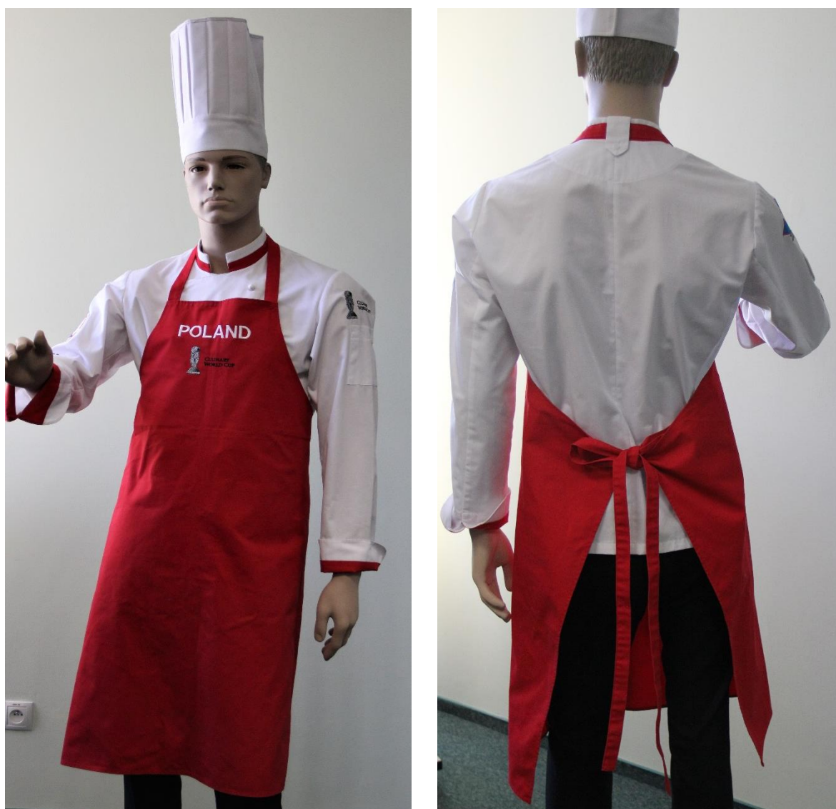
Fotografia 6 - Fartuch frontowy - fotografia pogładowa