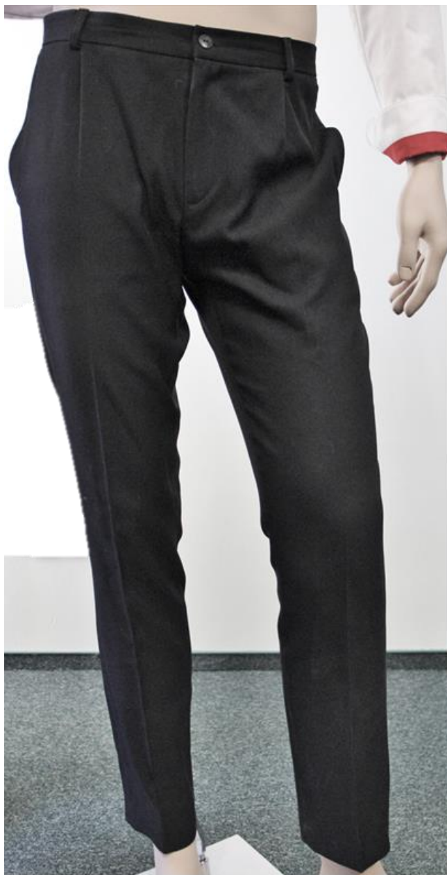
Fotografia 2 - Spodnie wyjściowe - fotografia pogładowa