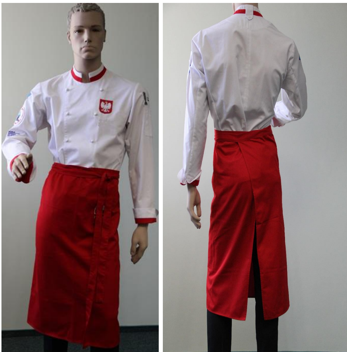
Fotografia 7 - Zapaska frontowa - fotografia poglądowa

Zapaska frontowa o wymiarach (szerokość 100,0 ± 5,0 cm, długość 70,0 ± 5,0 cm). Zapaska wykonana z tkaniny poliestrowo-bawełnianej w kolorze czerwonym. Masa powierzchniowa tkaniny 160 g/m 2 ± 10 g/m 2 . Góra zapaski wszyta w pasek wykonany z tkaniny zasadniczej przechodzący w wiązanie. W przedniej części zapaski wskazane są dwie symetrycznie rozmieszczone zakładki skierowane do boku. Krawędzie boczne i krawędź dolna zapaski podwinięte. Na zapasce wyhaftowany napis POLAND w kolorze białym, pod nim wyhaftowane nazwisko użytkownika (napis w kolorze czarnym), poniżej logo Pucharu Świata w Luxemburgu 2022 , obok wyhaftowany napis CULINARY WORLD CUP w kolorze czarnym.