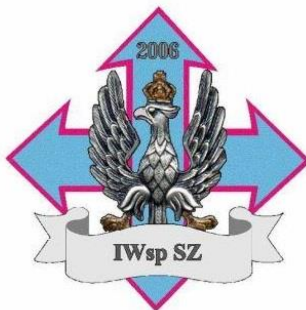
Fotografia 11 - Logo Inspektoratu Wsparcia Sił Zbrojnych - fotografia poglądowa