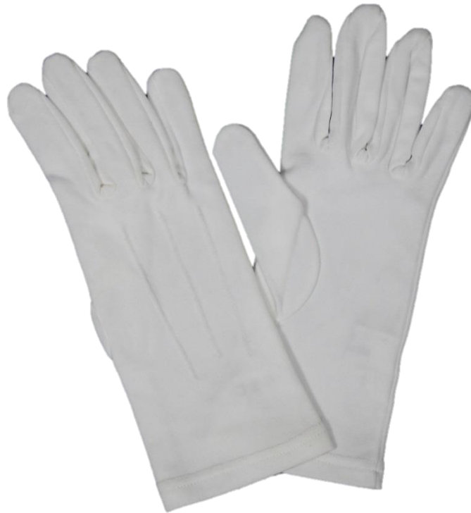
Rękawiczki kelnerskie - fotografia poglądowa

Rękawiczki kelnerskie, pięciopalcowe z anatomicznym układem kciuka, wykonane z dzianiny bawełnianej w kolorze białym. Masa powierzchniowa dzianiny 200 \text{ g/m}^2 \pm 20 \text{ g/m}^2 . Część chwytana rękawiczki pokryta wysokiej jakości mikro nakropieniem z PCV. Na wierzchniej części rękawiczki wykonane trzy ozdobne szwy stebnowe. Od strony wewnętrznej wykonane marszczenie na wysokości nadgarstka.