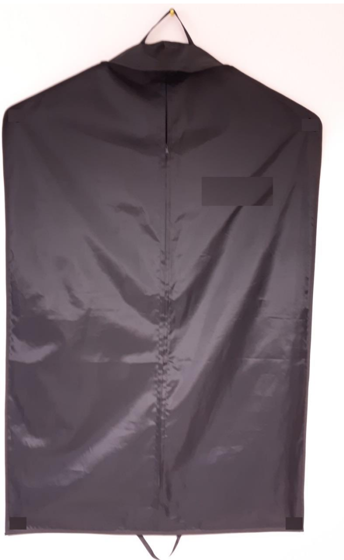
Fotografia 8 - Pokrowiec na odzież - fotografia pogładowa

Pokrowiec na odzież wykonany z tkaniny poliestrowej lub poliamidowej z apreturą wodoodporną w kolorze czarnym. Wymiary pokrowca długość 110,0 \pm 5,0 cm, szerokość 70,0 \pm 3,0 cm. Masa powierzchniowa tkaniny 200 \text{ g/m}^2 \pm 20 \text{ g/m}^2 . Pokrowiec zapinany na zamek błyskawiczny średnio spiralny (w kolorze czarnym). Pokrowiec wyposażony w uchwyty z taśmy umożliwiające przenoszenie w ręku złożonego w połowie pokrowca. W górze pokrowca umieszczone kliny na otwór uchwyty wieszaka. W tyle pokrowca u dołu wykonana duża kieszeń na drobne elementy garderoby. Kieszeń zapinana na zamek błyskawiczny dwu suwakowy średnio spiralny (w kolorze czarnym). Na górnej lewej części pokrowca wyhaftowane nazwisko użytkownika (haft w kolorze białym lub złotym).