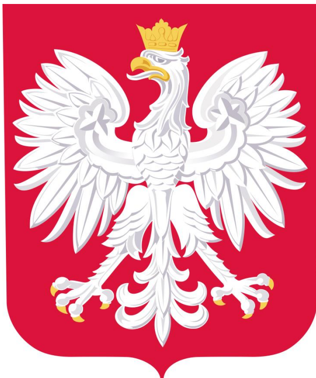
Fotografia 10 – Godło Rzeczypospolitej Polskiej

Poniżej przedstawiono poglądowy wygląd haftów emblematów zastosowanych ww. wyrobach.