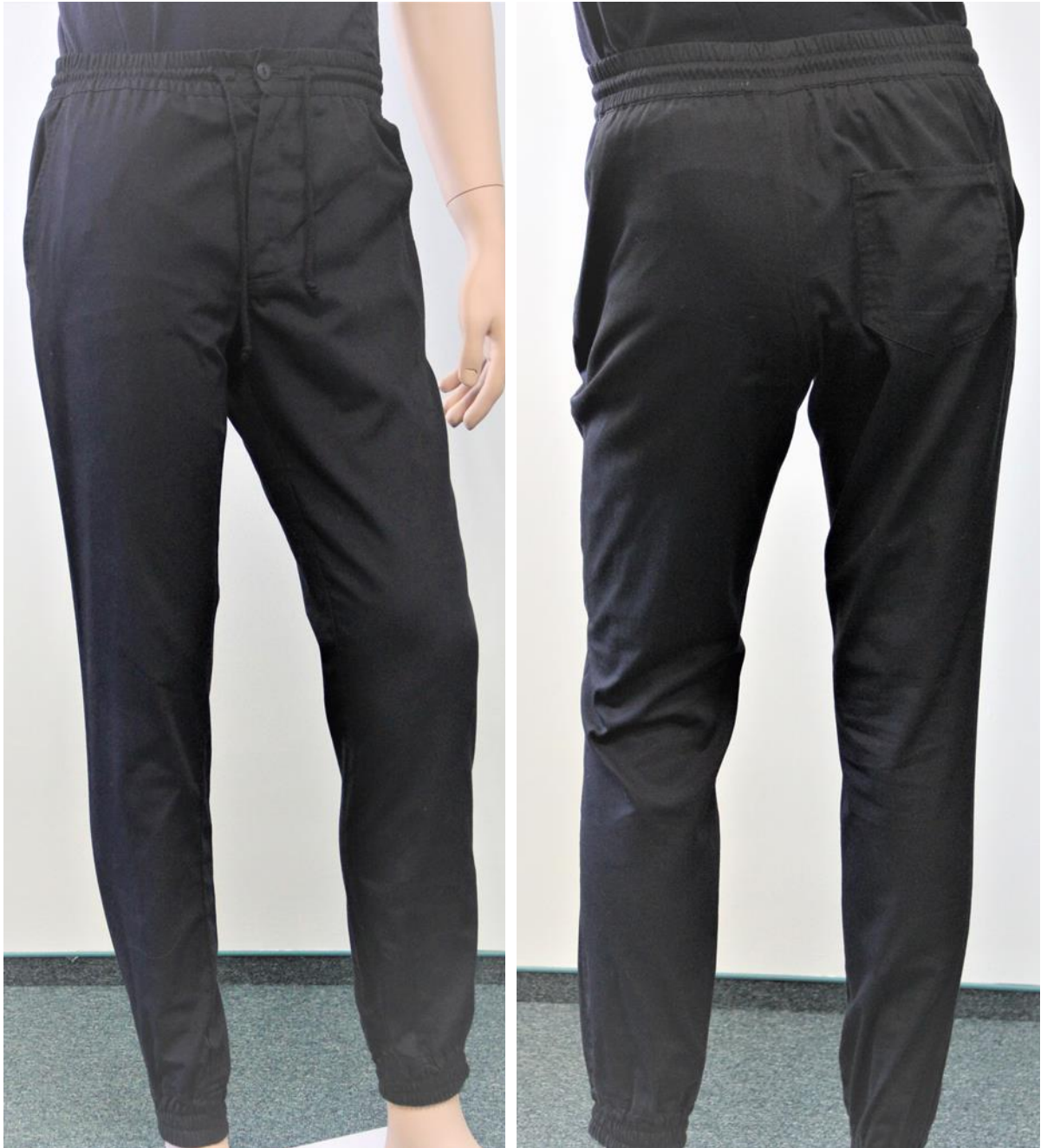
Fotografia 3 - Spodnie - fotografia poglądowa