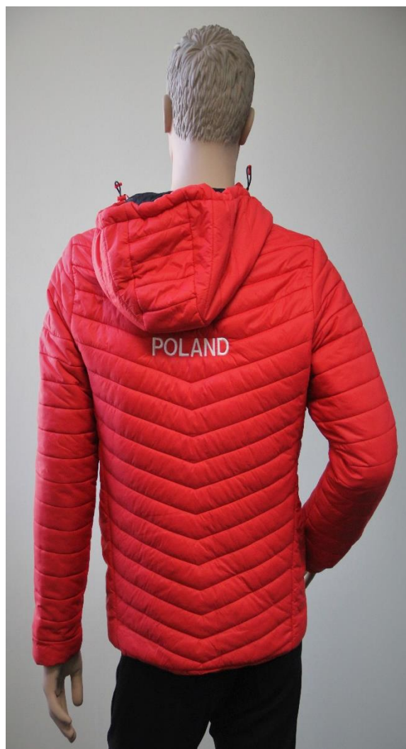
Fotografia 4 - Kurtka - fotografia poglądowa