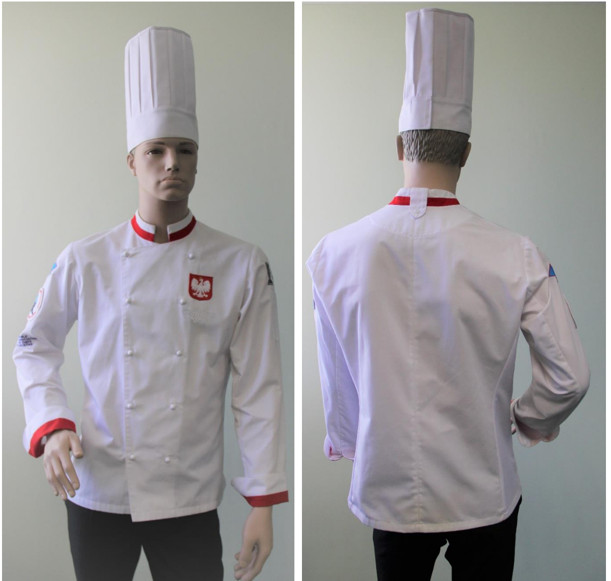
Fotografia 1 - Bluza z długimi rękawami - fotografia poglądowa