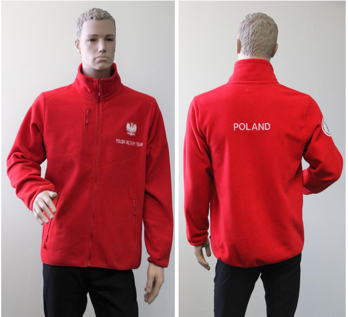
Fotografia 5 - Bluza ocieplająca - fotografia pogładowa