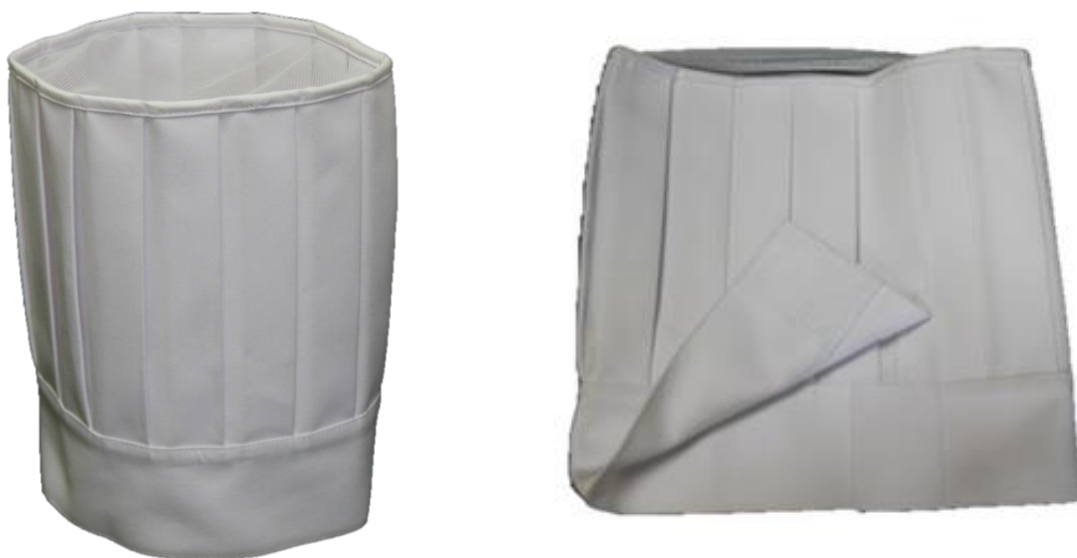
Fotografia 9 - Czapka kucharska - fotografia pogładowa

Wysokość czapki wynosi (26,0 \pm 0,5) cm). Czapka posiada rozmiar uniwersalny.