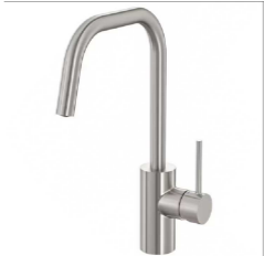
ÄLMAREN Bateria kuchenna, stalowy