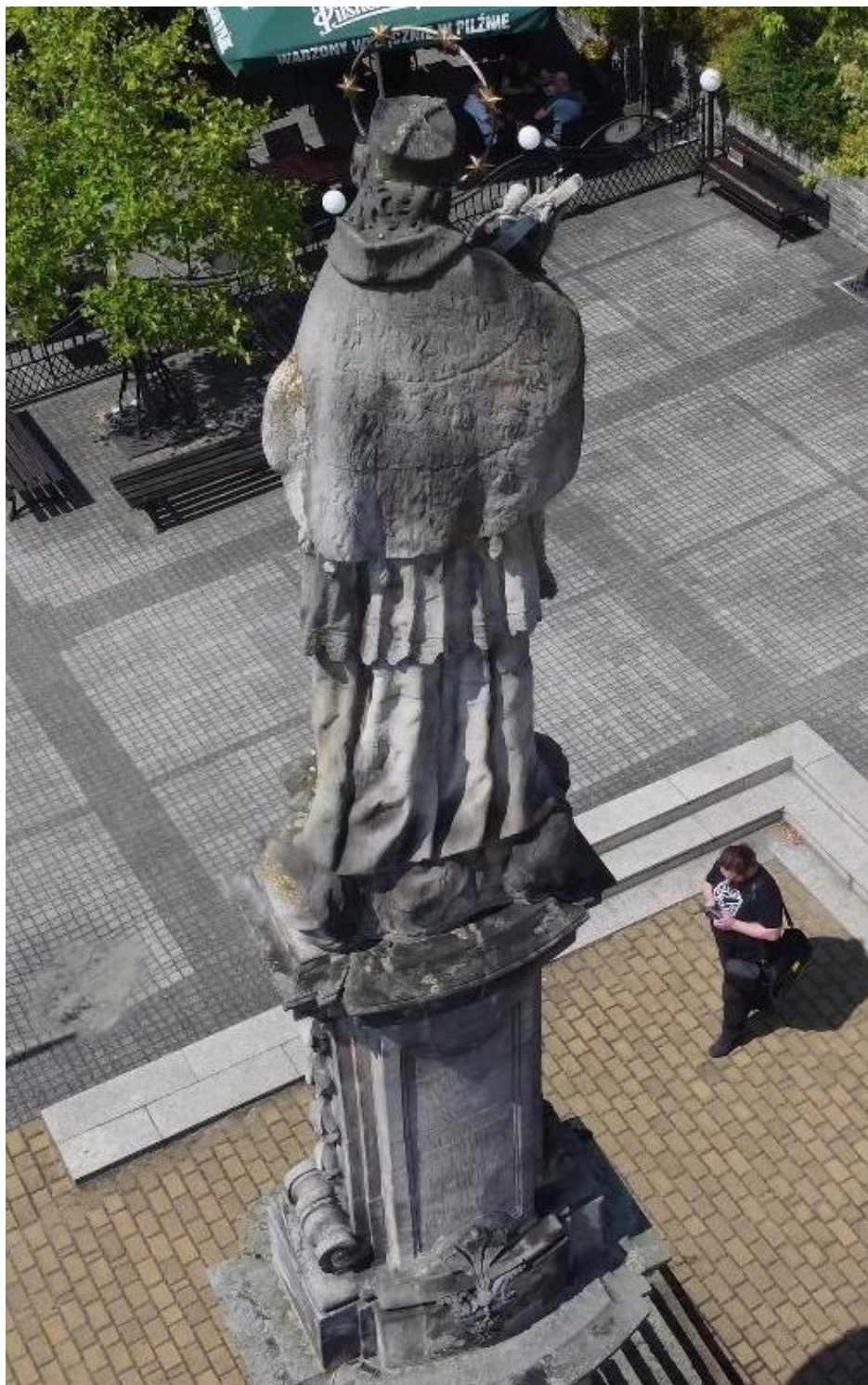
Il. nr 3 Pomnik św. Jana Nepomucena na Rynku w Toszku, 1725 r. Widok od strony wschodniej. Stan przed konserwacją. data: sierpień 2022