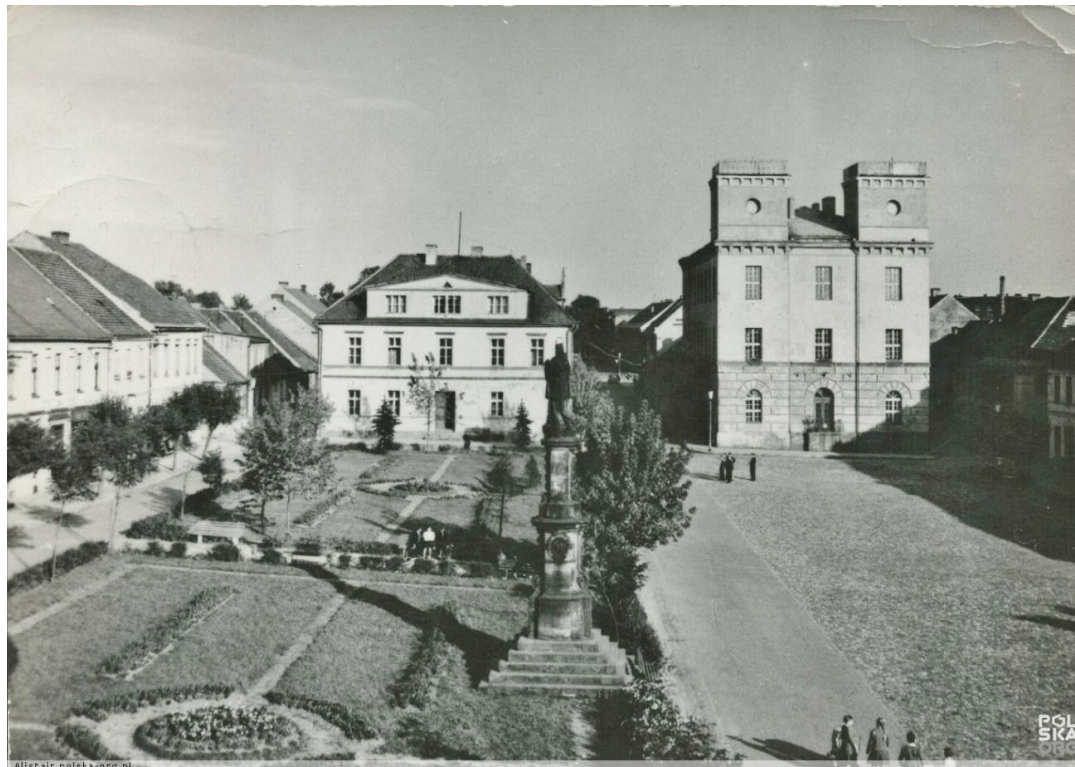
Zdjęcie z lat 1960-1970.