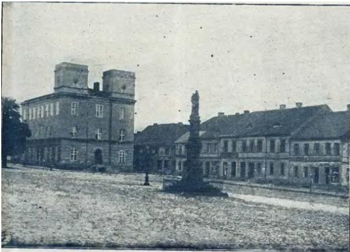
Ring mit Rathaus und dem Standbild des hl. Johannes von Nepomuk.