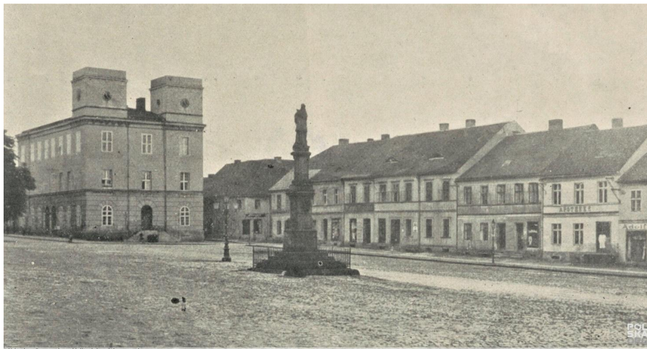
Zdjęcie z roku 1927, widoczna krata wokół pomnika. [dostęp 09 2022: https://polska-org.pl/9067456,foto.html?idEntity=8213457 ]