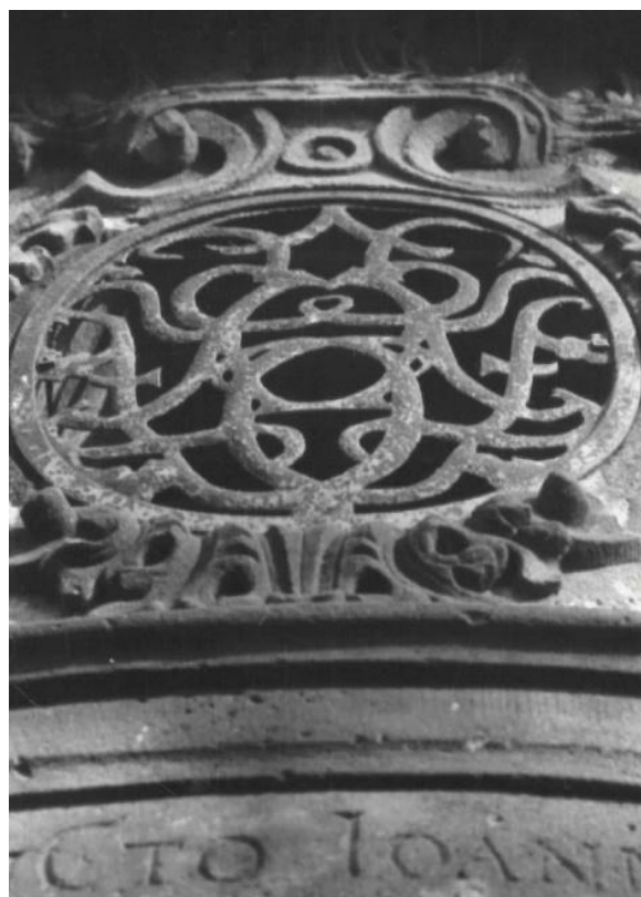
Zdjęcia z Karty zabytku, rok 1968. Po prawej oryginalna krata z monogramem Maryi.