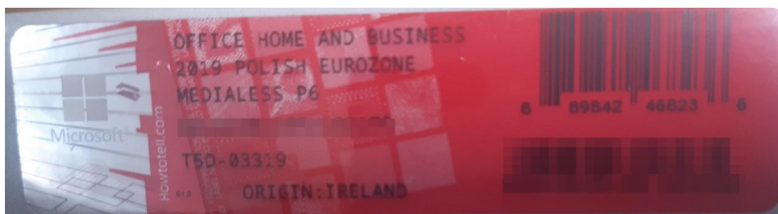
Rys. 2 przykładowy kod zabezpieczony przez producenta systemu Microsoft Windows Office Home&Business z wymazanym, znajdującym się w prawym dolnym rogu numerem seryjnym produktu. Kod licencyjny znajduje się w środku szczelnie zapakowanego i zafoliowanego pudełka (Rys. 3)