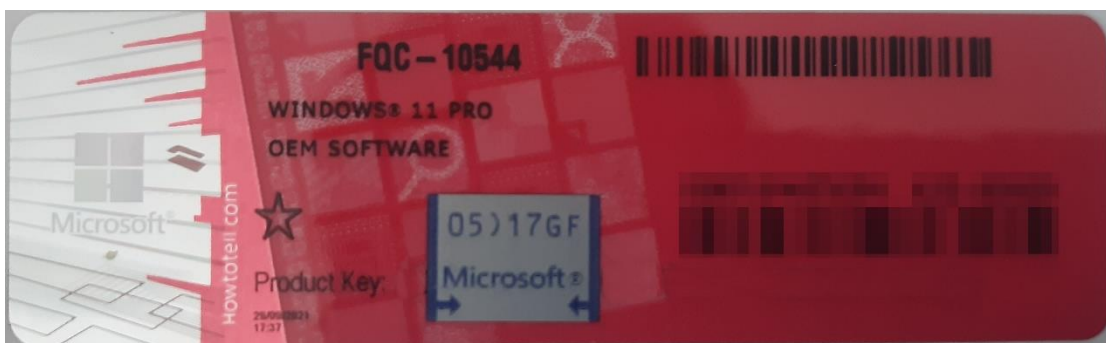
Rys. 1 przykładowy kod zabezpieczony przez producenta systemu Microsoft Windows 11 (takie same naklejki mają Windows 10) z wymazanym, znajdującym się przed i za szarą naklejką kodem licencyjnym

Poniższe zdjęcie obrazuje obecnie stosowane zabezpieczenia producenta firmy Microsoft (klucz systemu jest zabezpieczony naklejką hologramową przez producenta. Po jej zdrapaniu uzyskujemy dostęp do oryginalnego klucza):