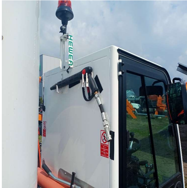
Wąż myjki wysokociśnieniowej o długości 11 m (opcja)