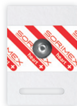
EK-S 60 P

55 x 40 mm żel ciekły pianka polietylenowa opak. jedn.: 50 szt. opak. zbiorcze: 1500 szt.