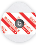
EK-S 45 PSG

45 x 42 mm żel stały pianka polietylenowa opak. jedn.: 50 szt. opak. zbiorcze: 1500 szt.