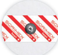
EK-S 55 PSG

Ø 55 mm żel stały pianka polietylenowa opak. jedn.: 50 szt. opak. zbiorcze: 1500 szt.