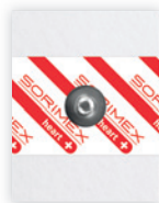
EK-S 44 PSG

44 x 30 mm żel stały pianka polietylenowa opak. jedn.: 50 szt. opak. zbiorcze: 2000 szt.