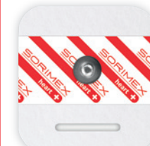
EK-S 61 PSG

55 x 53 mm żel stały pianka polietylenowa opak. jedn.: 50 szt. opak. zbiorcze: 1500 szt.