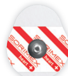
EK-S 42 PSG

42 x 36 mm pianka polietylenowa opak. jedn.: 50 szt. opak. zbiorcze: 2000 szt.