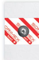
EK-S 56 P

55 x 35 mm żel ciekły pianka polietylenowa opak. jedn.: 50 szt. opak. zbiorcze: 1500 szt.