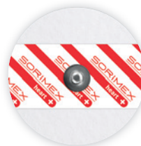
EK-S 50 P

Ø 50 mm żel ciekły pianka polietylenowa opak. jedn.: 50 szt. opak. zbiorcze: 1500 szt.