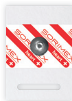
EK-S 60 PSG

55 x 40 mm żel stały pianka polietylenowa opak. jedn.: 50 szt. opak. zbiorcze: 2000 szt.