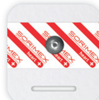
EK-S 61 P

55 x 53 mm żel ciekły pianka polietylenowa opak. jedn.: 50 szt. opak. zbiorcze: 1200 szt.