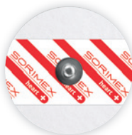
EK-S 50 PSG

Ø 50 mm żel stały pianka polietylenowa opak. jedn.: 50 szt. opak. zbiorcze: 1500 szt.