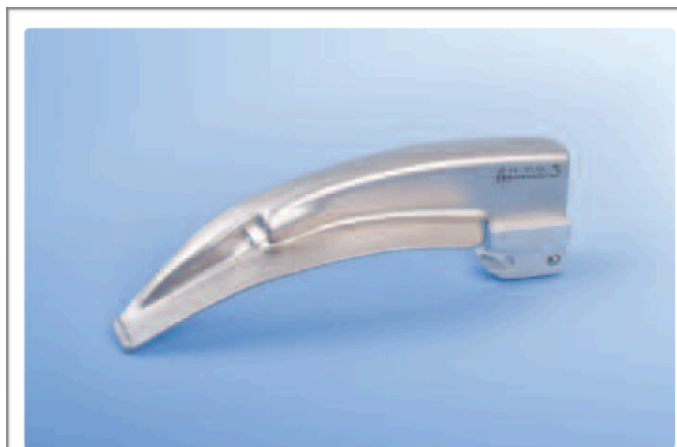
Nr katalogowy 90.003.10.699-705