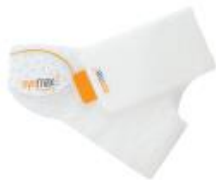
PREEMIE (10,4" – 12,6") (Obwód czołowo-potyliczny)