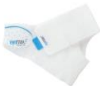
REGULAR (12,6" – 14,9") (Obwód czołowo-potyliczny)