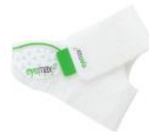
MICRO (7,87" – 10,4") (Obwód czołowo-potyliczny)