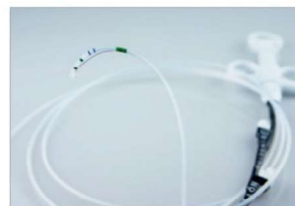
Papillotom z uchwytem