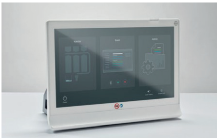
Dotykowy ekran sterujący