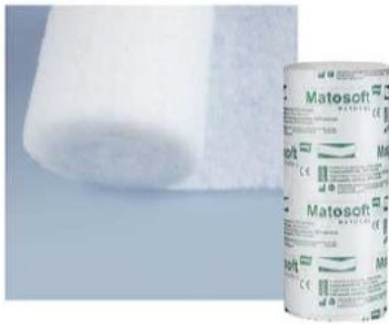
NATURALNY PODKŁAD PODGIPSOWY NIEJAŁOWY

Wykonany w 100% wiskoza, nominalna masa powierzchniowa 83 g/m 2 , chłonność wody min. 20 g/g.