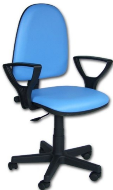
Zdj.1 Zdjęcie poglądowe