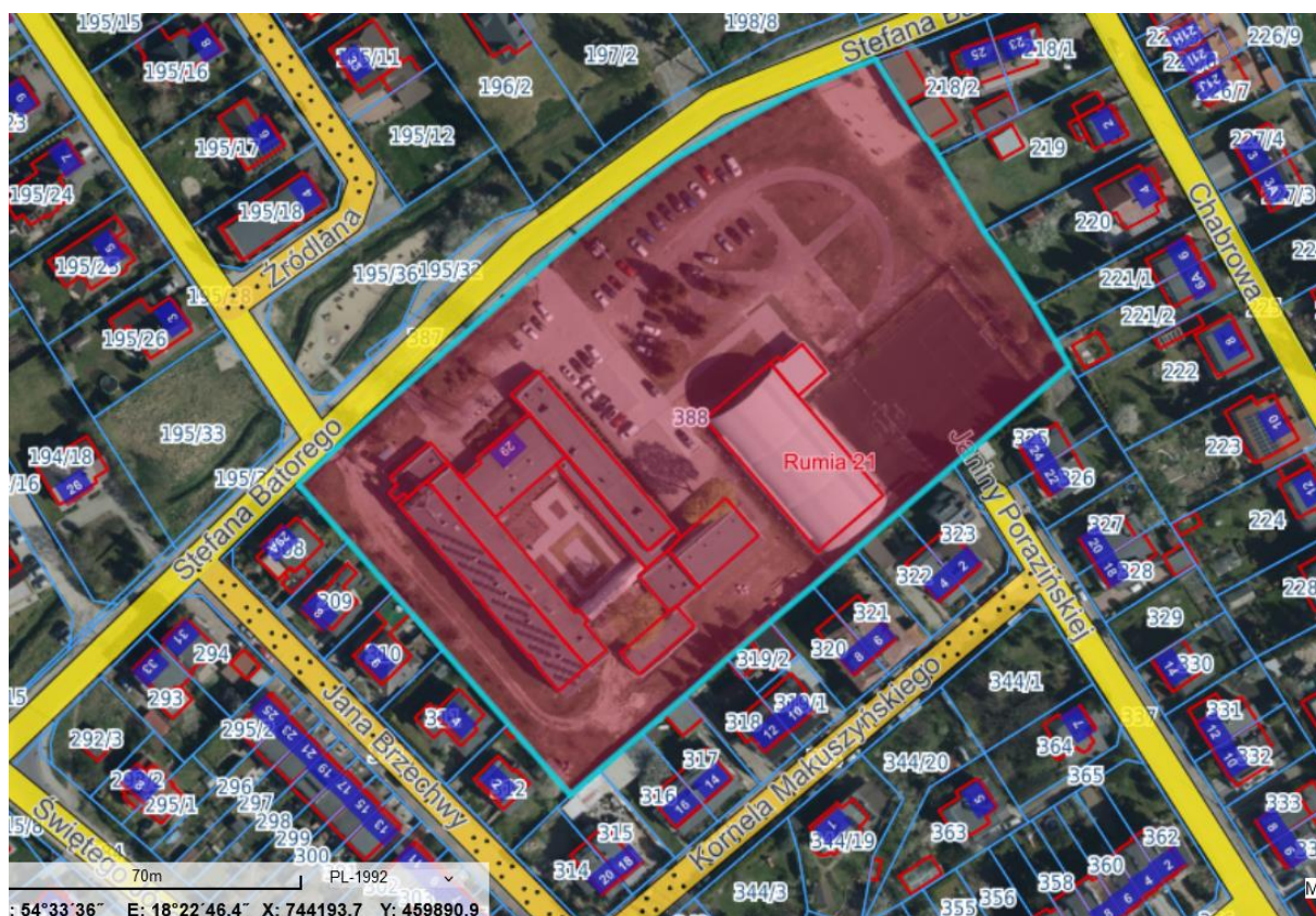
Rys. 1 Lokalizacja terenu inwestycji na tle ortofotomapy (rumia.e-mapa.net)