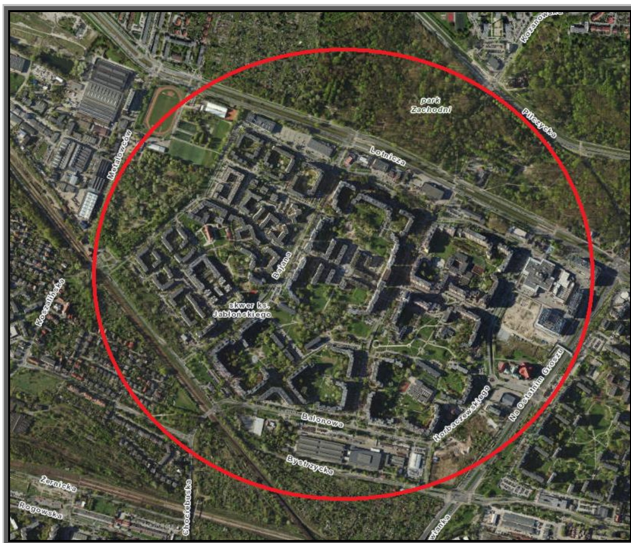
Rys. 2 Zakres zamówień podobnych

Dotyczy to również terenów bezpośrednio przyległych do obszarów wskazanych powyżej lub innych, na obszarze, których roboty należy wykonać w konsekwencji zleconego zakresu zamówienia. Ewentualny zakres powyższych zamówień będzie podobny do zakresu zleconego w ramach niżej podanych pozycji: