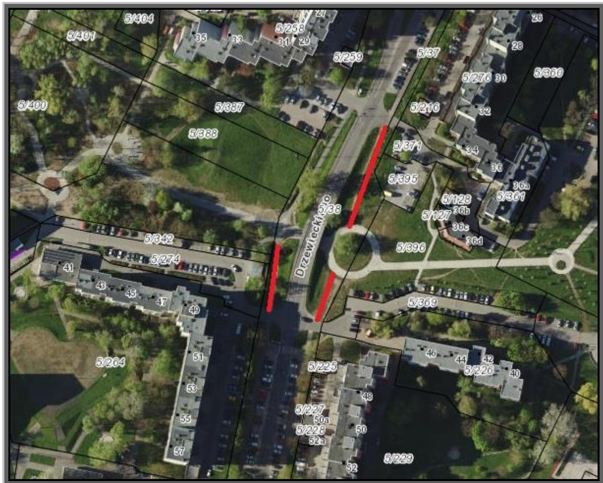
Rys. 1 Plan orientacyjny lokalizacji zadania nr 7

Zakres rzeczowy inwestycji, można podzielić na: