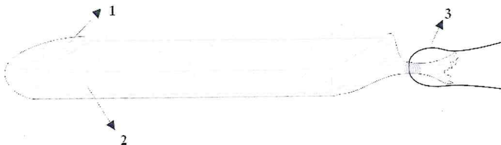
1—rozpuszczalna gaza hemostatyczna 2—gąbka 3—sznurek