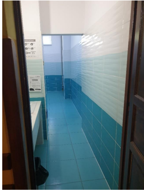
Fot. Istniejące łazienki po modernizacji