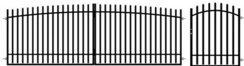
Przykład nowej bramy – zdjęcie poglądowe