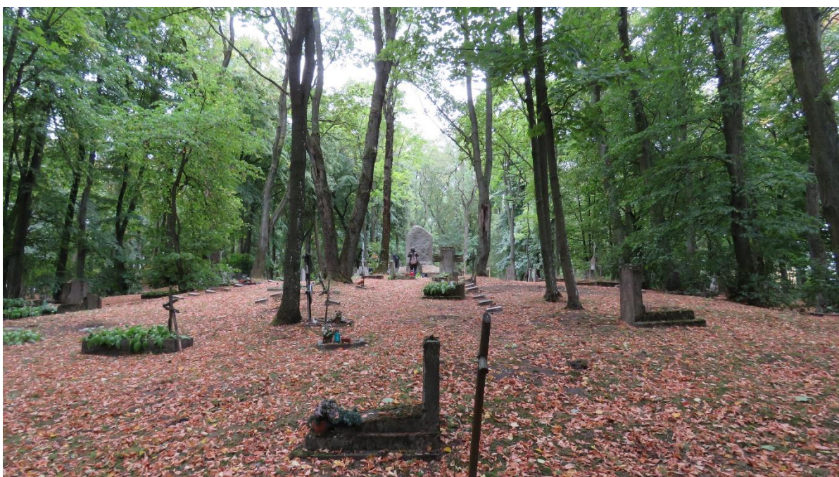
Teren kwatery wojennej z czasów I wojny światowej na zabytkowym cmentarzu miejskim (widok z południa na północ)