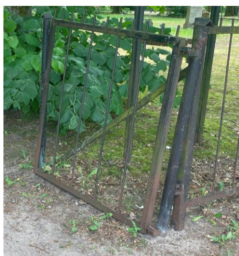
Brama główna i furtka – stan obecny