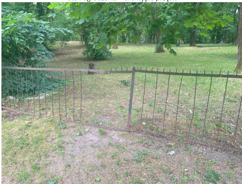
Stan ogrodzenia – brakujące pręty