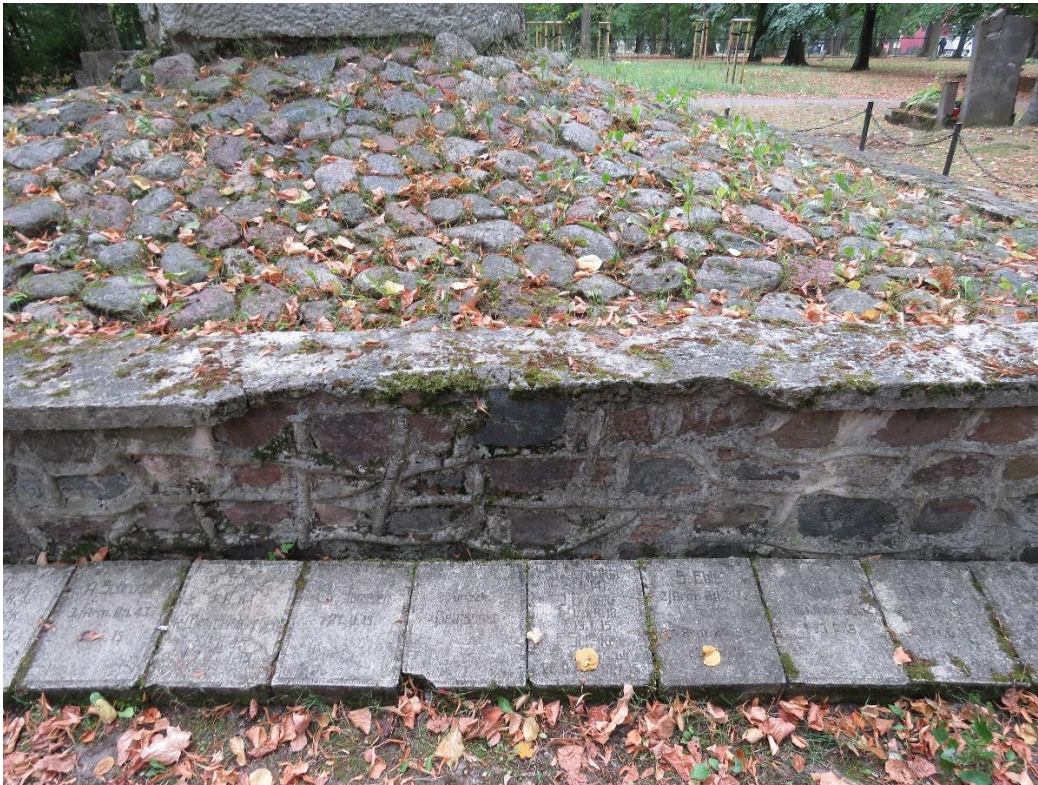
Stan cokofu pomnika