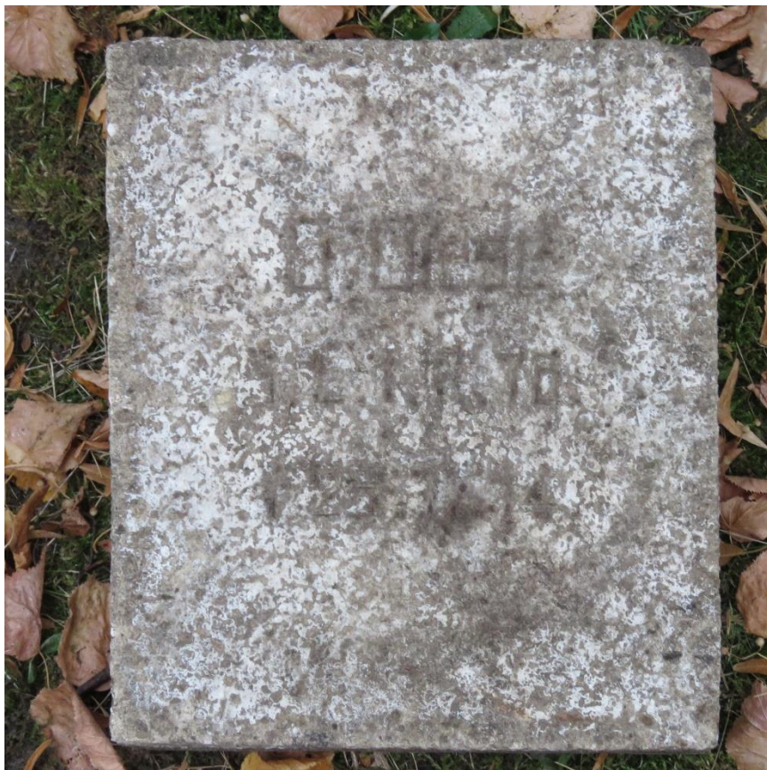
Przykładowy nagrobek żołnierski