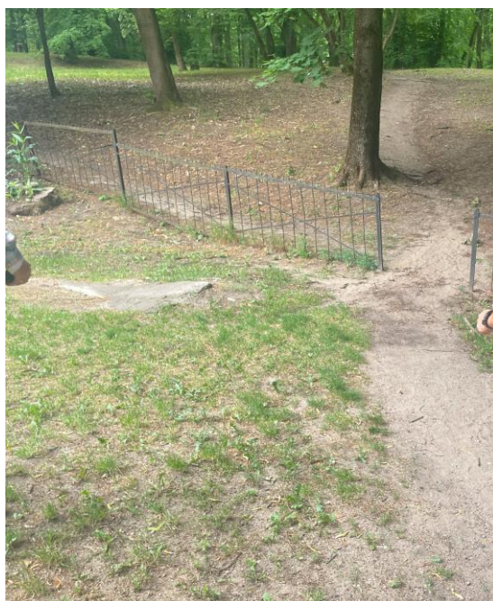
Ogrodzenie- miejsce w którym należy zamontować nową furtkę