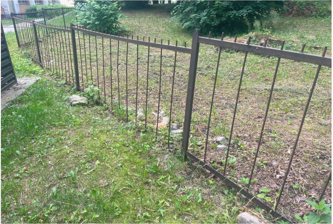
Stan ogrodzenia ukazujący potrzebną niwelację gruntu