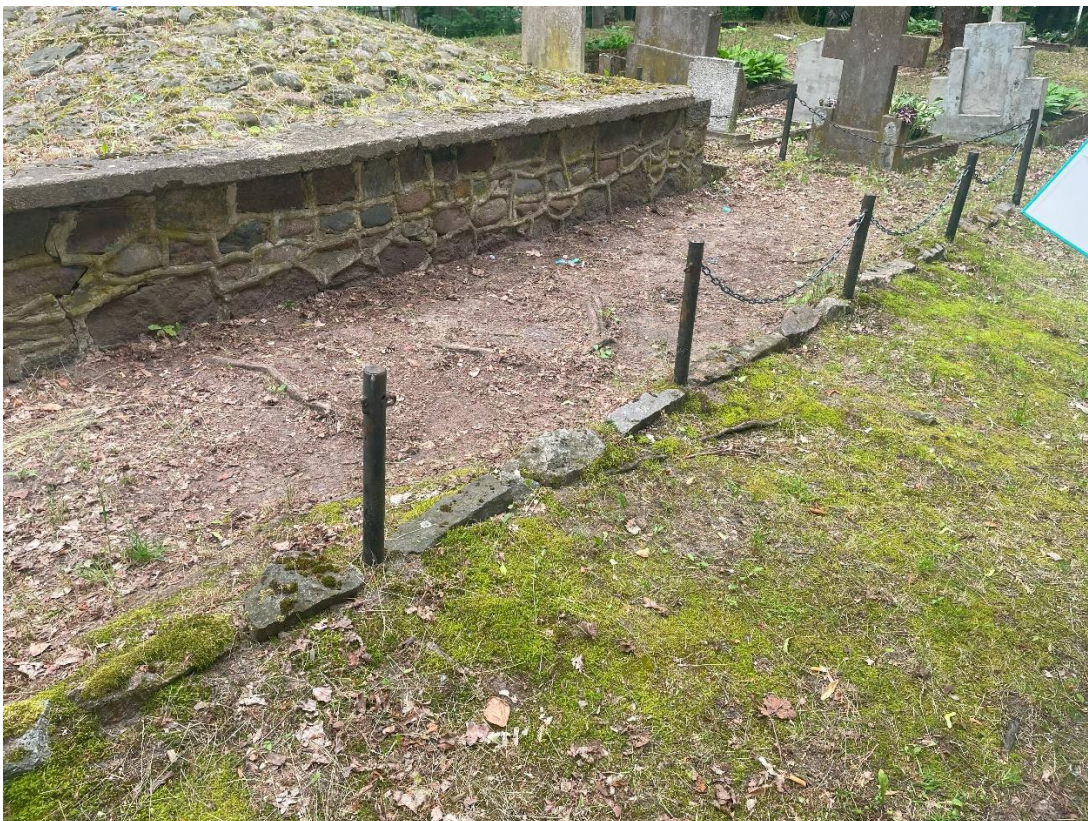
Stan płotka okalającego pomnik