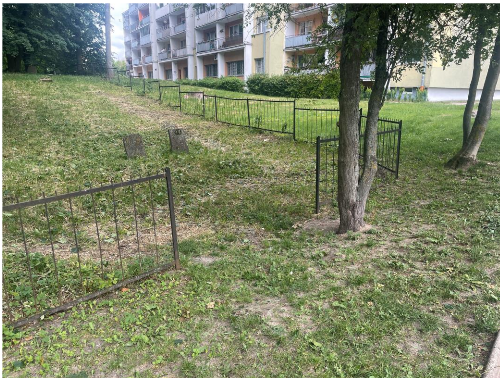
Stan ogrodzenia – brakujące przęsło