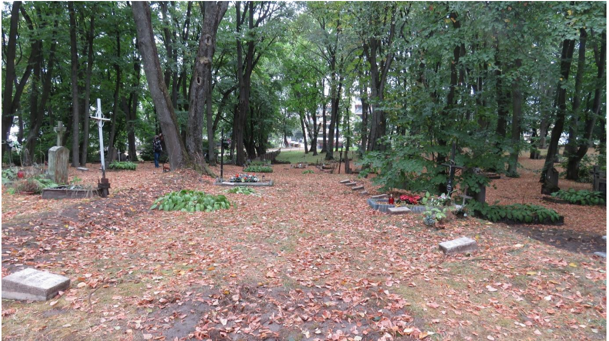
Teren kwatery wojennej z czasów I wojny światowej na zabytkowym cmentarzu miejskim (widok z północy na południe)