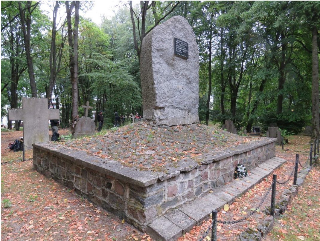
Pomnik ku czci żołnierzy poległych podczas I wojny światowej