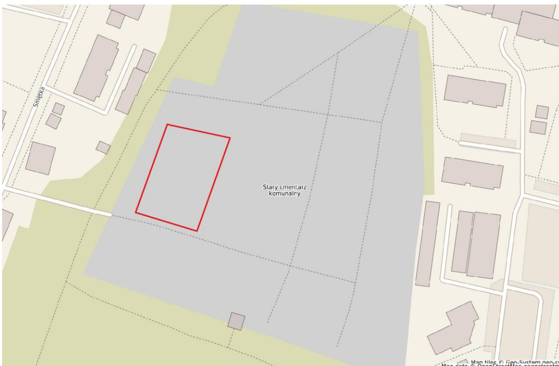
Lokalizacja kwatery wojennej z czasów I wojny światowej wraz z pomnikiem na zabytkowym cmentarzu miejskim w Giżycku