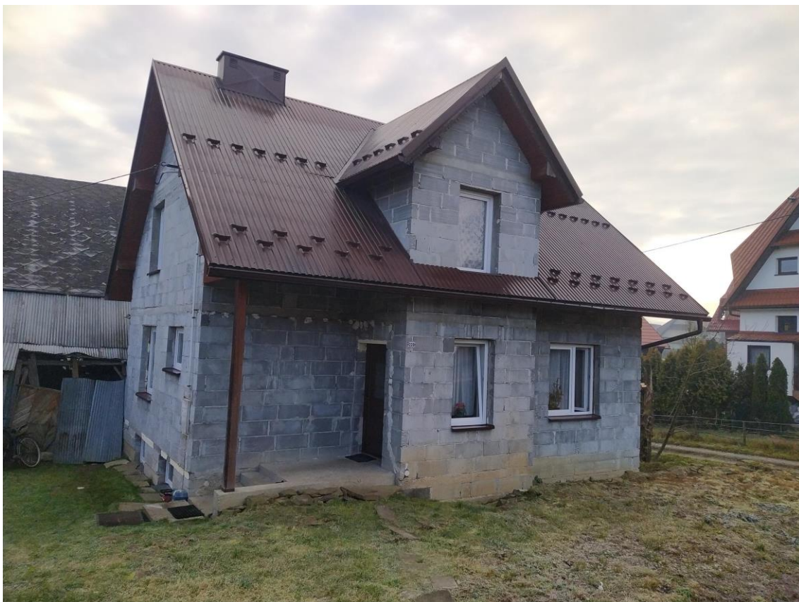
widok od strony W