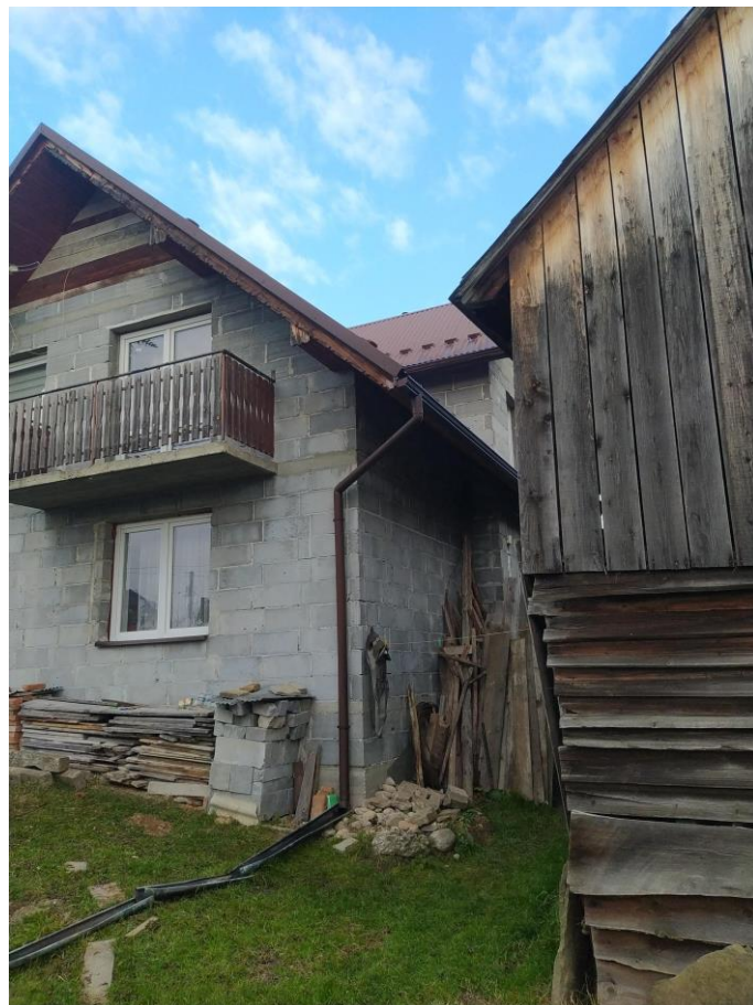
widok od strony E