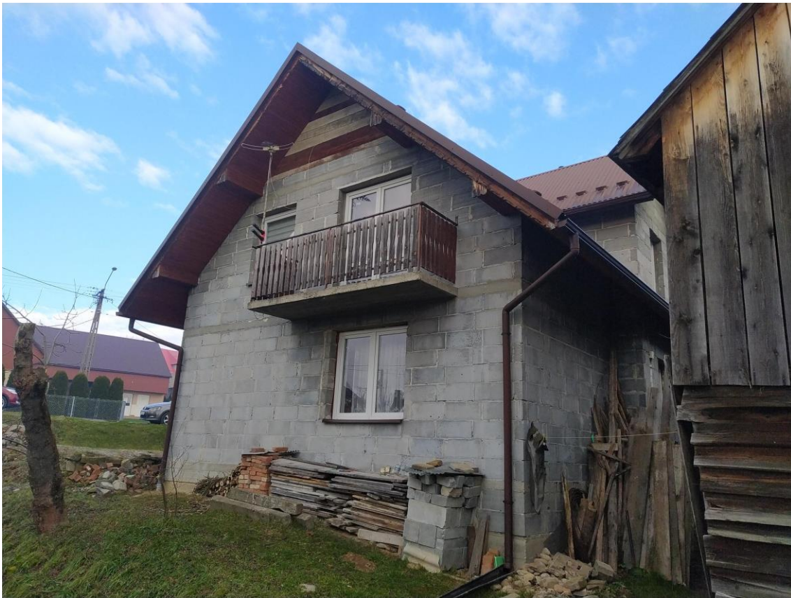
widok od strony S