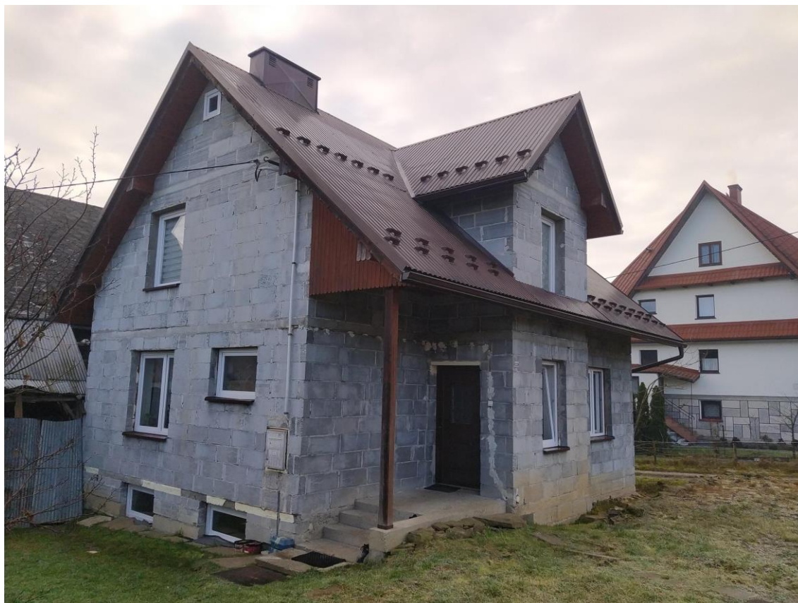
widok od strony N