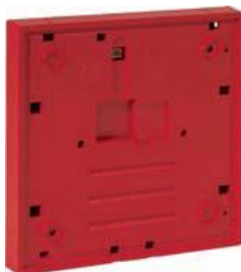
Obraz 8. Radiointerfejs

Radiointerfejs stanowi uniwersalny adapter umożliwiający bezprzewodową komunikację z radiotransponderem lub radiobramką, a przez nie z pętlą i systemem sygnalizacji pożaru. Radiointerfejs umożliwia bezprzewodową pracę Ręcznym Ostrzegaczom Pożarowym w wersji standardowej i małej, cyfrowym sygnalizatorom (optycznym, akustycznym, z komunikatami głosowymi) oraz czujkom ze zintegrowanym sygnalizatorem (optycznym, akustycznym, z komunikatami głosowymi). Przyciski ROP, sygnalizatory i czujki w wersji radiowej posiadają indywidualny adres w systemie.