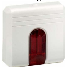
Obraz 3. Wskaźnik zadziałania czujki

Wskaźnik zadziałania jest urządzeniem przeznaczonym do optycznego powtórzenia sygnalizacji stanu alarmowania czujki, grupy czujek lub innego elementu dozоровego. Może być dołączony do czujek adresowalnych lub konwencjonalnych. Stosuje się głównie w miejscach, w których czujka nie jest widoczna, np. znajduje się w przestrzeni międzysufitowej lub pomieszczeniu bez dostępu obsługi obiektu.