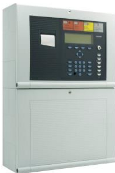
Obraz 1. Centrala systemu sygnalizacji pożaru z obudową na akumulatory

Zaprojektowany system jest systemem mikroprocesorowym w pełni adresowalnym analogowym tzn. umożliwia identyfikację numeru i rodzaju każdego elementu liniowego zainstalowanego w adresowalnej linii dozorowej.