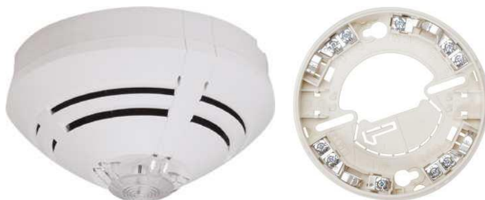
Obraz 2. Automatyczna czujka pożarowa, Gniazdo czujki

Dzięki swoim właściwościom detekcyjnym czujka jest w stanie wykrywać pożary testowe od TF1 do TF6. Multisensorowa czujka nadaje się także do pracy w warunkach, w których panuje temperatura do +65 °C.