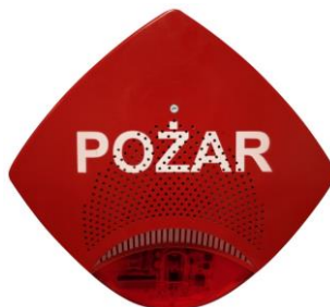
Obraz 10. Zewnętrzny sygnalizator akustyczno-optyczny

Sygnalizator składa się z obudowy wykonanej z tworzywa sztucznego, układu elektronicznego oraz lampy, w której umieszczony jest palnik ksenonowy. Jako źródło dźwięku zastosowano dwa przetworniki piezoceramiczne. Sygnalizator generuje jednocześnie sygnał akustyczny wraz z sygnałem optycznym. Przewody zasilające podłącza się zgodnie z oznaczeniami umieszczonymi na obudowie sygnalizatora. W korpusie sygnalizatora umieszczone jest złącze zasilające oraz czteropozycyjny mikroprzełącznik, za pomocą którego możliwe jest wybranie trybu pracy sygnalizatora – „master” lub „slave”, wzoru dźwięku (1 z 4) oraz zmniejszenie głośności sygnalizatora o około 10dB (zmiana skokowa).