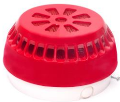
Obraz 9. Wewnętrzny sygnalizator akustyczny

Sygnalizator po podłączeniu napięcia zasilania zaczyna generować sygnał akustyczny wg nastawionego wzorca. Potencjometr umożliwia regulację głośności sygnału akustycznego. W zależności od nastawy mikroprzełącznika znajdującego się w obudowie sygnalizatora, możliwy jest wybór jednego z czterech sygnałów dźwiękowych, natomiast zakres regulacji głośności waha się przedziale od około 70 dB @ 1 m do >100 dB @ 1 m.