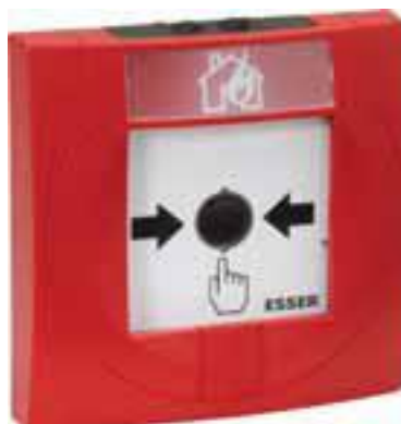
Obraz 4. Ręczny ostrzegacz pożaru