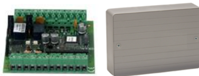
Obraz 12. Sterownik 4we/2wy z obudową n/t