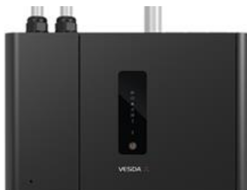
Obraz 5. Detektor zasysający 1-rurowy