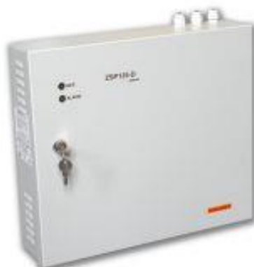
Obraz 13. Zasilacz urządzeń przeciwpożarowych

Zasilacze z podtrzymaniem bateryjnym ty dostarczają napięcia gwarantowanego z sieci elektroenergetycznej lub przy jej zaniku z wewnętrznej baterii akumulatorów. Wyposażone są w dwa wyjścia zabezpieczone bezpiecznikami. Przy przejściu z zasilania sieciowego na bateryjne i odwrotnie, na wyjściach nie obserwuje się chwilowych zaników napięcia.