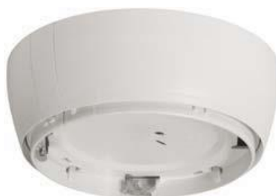
Obraz 7. Radiobramka/radiogniazdo