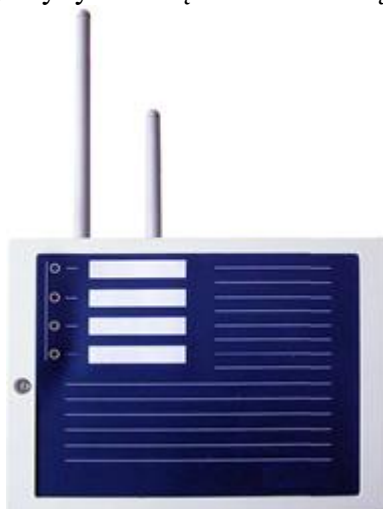
Obraz 6. Radiotransponder elementów bezprzewodowych

Dzięki temu istniejące systemy mogą być swobodnie rozszerzane o urządzenia radiowe, a niekiedy nowe projekty tylko dzięki temu rozwiązaniu mogą być zrealizowane.