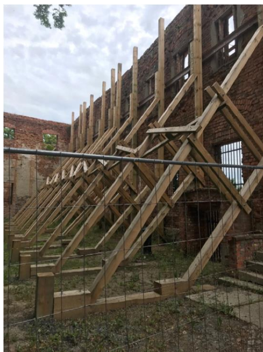
Rys.3 Zamek Piastowski w Krośnie Odrzańskim – skrzydło wschodnie, widok od strony dziedzińca

W marcu 2023 r. LWKZ stwierdził zły stan skrzydła zachodniego i północnego zamku. W piśmie LWKZ zwraca uwagę na konieczność podjęcia działań zabezpieczających zabytek – nr rej. L-81/2/A, tj. skrzydło północne i północną część zachodniego skrzydła zamku książęcego w Krośnie Odrzańskim w związku z oględzinami z dnia 07.03.2023 r. oraz zaobserwowanymi ubytkami materiału budowlanego, obsypującymi się ceglami, naruszonymi nadprożami okien w narożniku skrzydeł północnego i zachodniego.