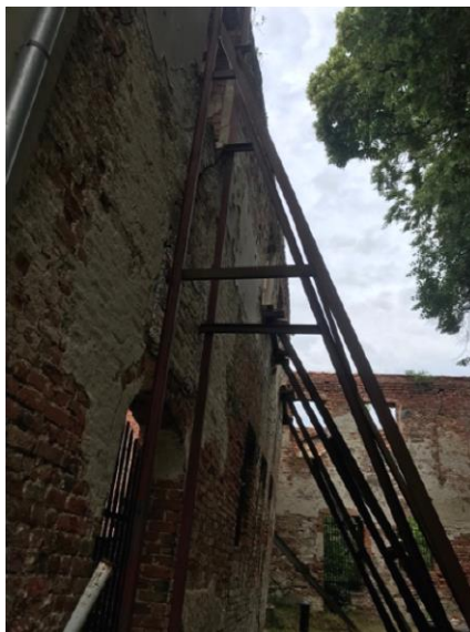
Rys.6 Zamek Piastowski w Krośnie Odrzańskim – skrzydło zachodnie