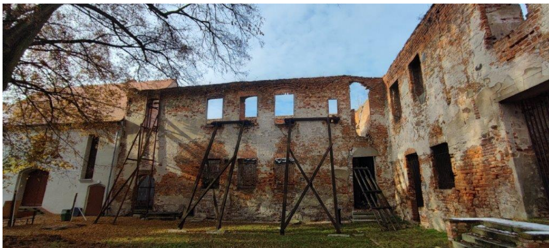
Rys.5 Zamek Piastowski w Krośnie Odrzańskim – skrzydło zachodnie