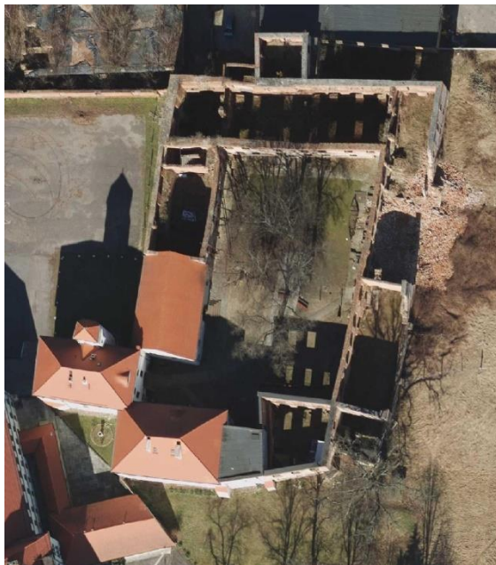
Rys.1 Zamek Piastowski w Krośnie Odrzańskim – widok z góry

Na początku stycznia 2022 r. doszło do zawalenia się części ściany wschodniej skrzydła wschodniego. Konieczna była pilna interwencji w zakresie zabezpieczenia i wzmocnienia oraz odgruzowania i naprawy zawalonej części murów fragmentu skrzydła wschodniego (po katastrofie budowlanej). W 2023 r. wykonano zabezpieczenie konstrukcji skrzydła wschodniego oraz uporządkowano teren po katastrofie tej części zamku w tym w szczególności: