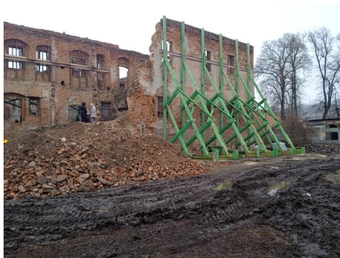
Rys.2 Zamek Piastowski w Krośnie Odrzańskim – skrzydło wschodnie