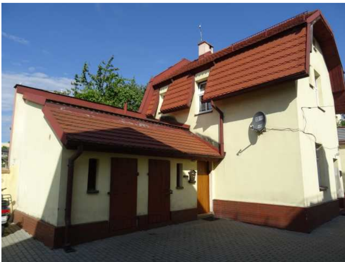
Sporządził : S. Niewolik