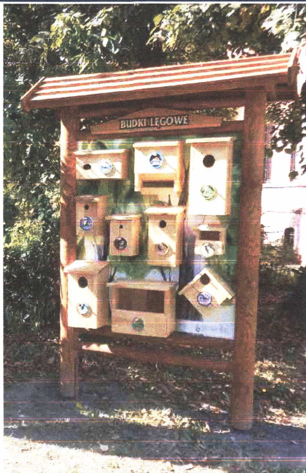
Zdjęcie poglądowe (NA PRZEDNIEJ STRONIE BUDKI, NA TYLNEJ STRONIE TABLIKA EDUKACYJNA)