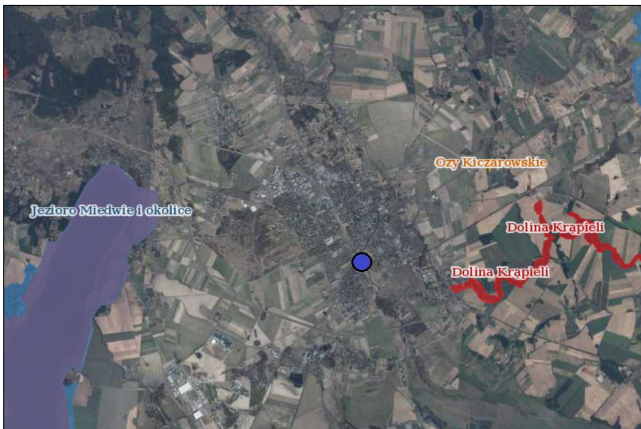
Rysunek 2. Lokalizacja studni na tle form ochrony przyrody

W najbliższej odległości (do 10 km) znajdują się następujące obszary: