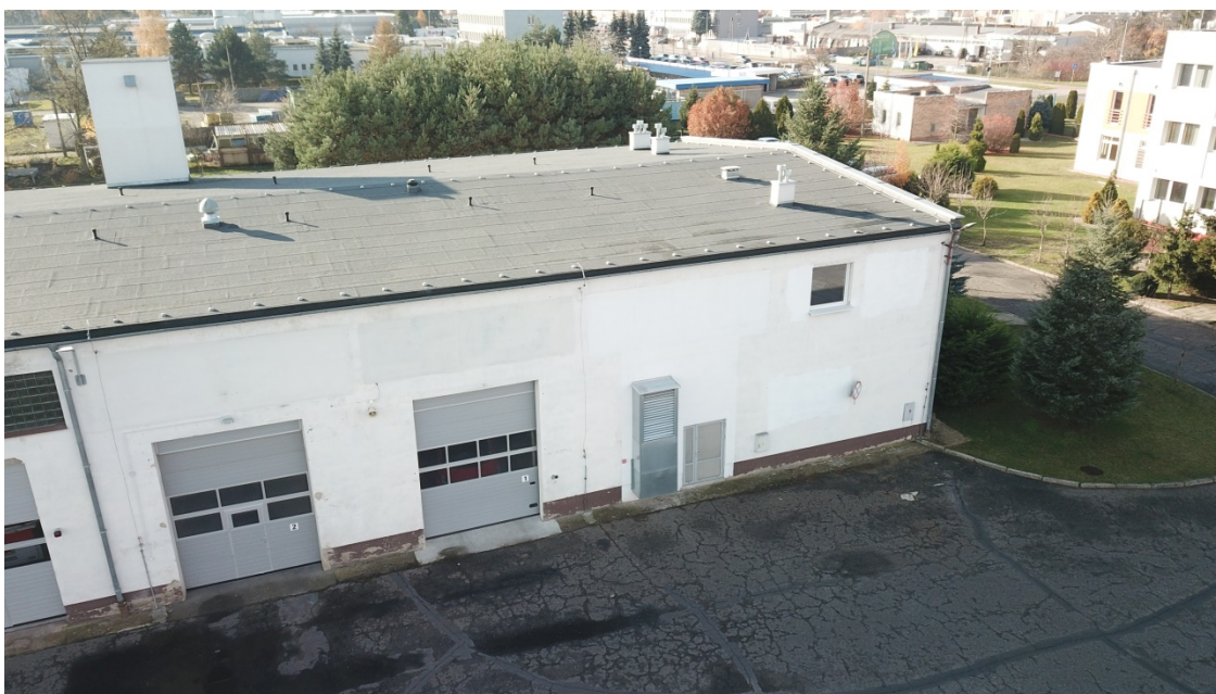
Rys.2 Planowane miejsce montażu paneli fotowoltaicznych (dach budynku). W pomieszczeniu z bramą nr 1 znajduje się główna tablica rozdzielcza budynku.