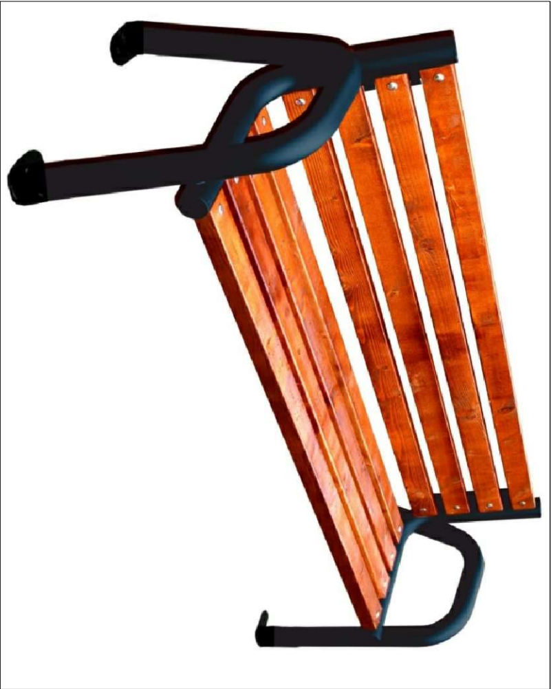
ŁAWKA ULICZNA - 5SZT.