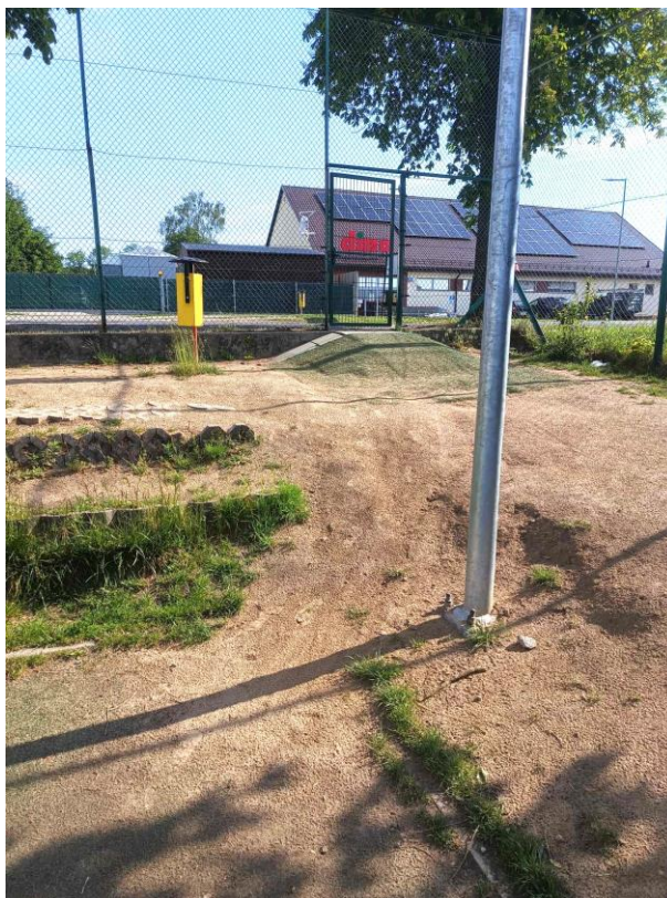
WIDOK NA WEJŚCIE NA TEREN BOISKA