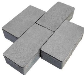
Kostka betonowa: 10 x 20 x 6 cm, kolor SZARY