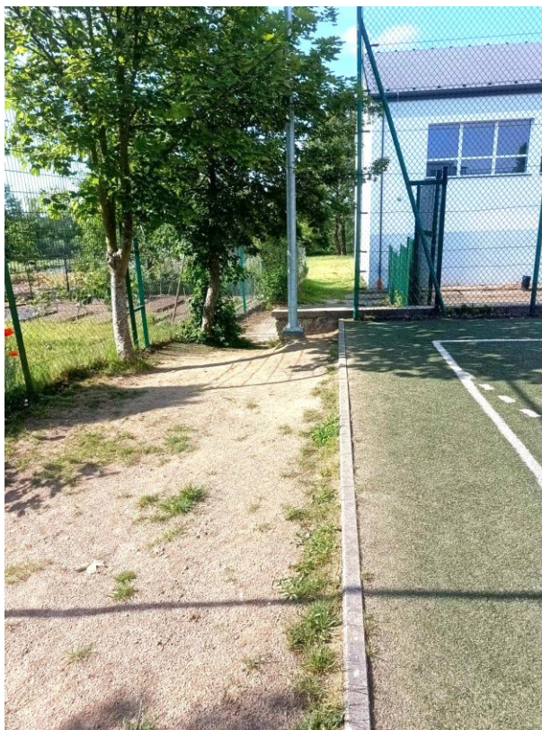
WIDOK NA WSCHODNIĄ CZĘŚĆ BOISKA