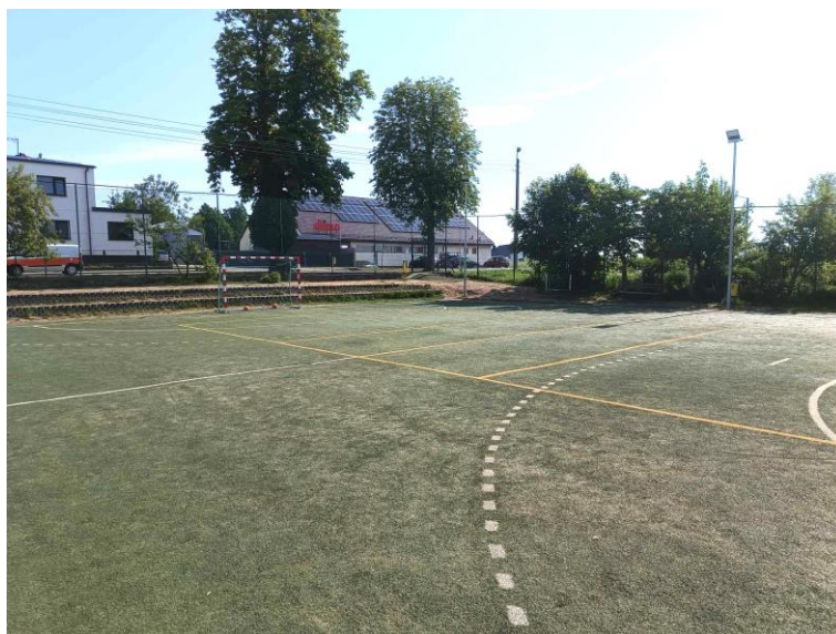
WIDOK NA BOISKO OD STRONY POŁUDNIOWO-ZACHODNIEJ

Na terenie objętym opracowaniem zlokalizowane jest boisko wielofunkcyjne o nawierzchni ze sztucznej trawy o powierzchni 644 m 2 w kształcie prostokąta o wym. 23 x 28 m z dwiema bramkami do gry w piłkę nożną.