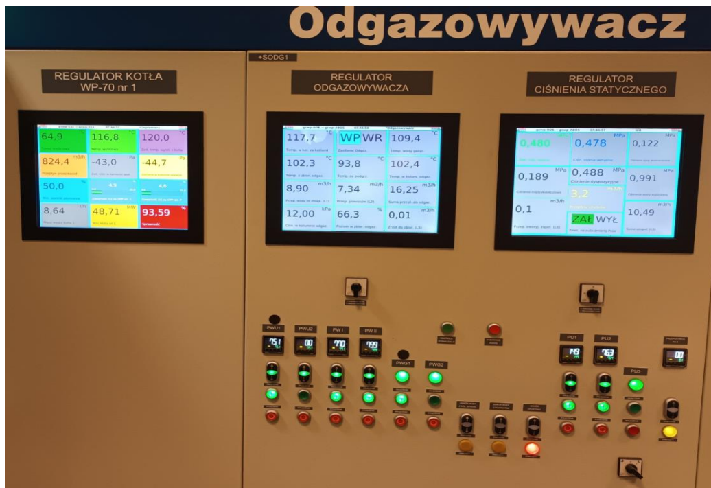
Regulator ciśnienia statycznego.