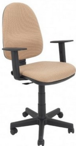
Zdj.1 Oferowany produkt