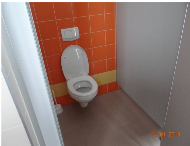
Widok ustępu jak w łazience na 3 piętrze