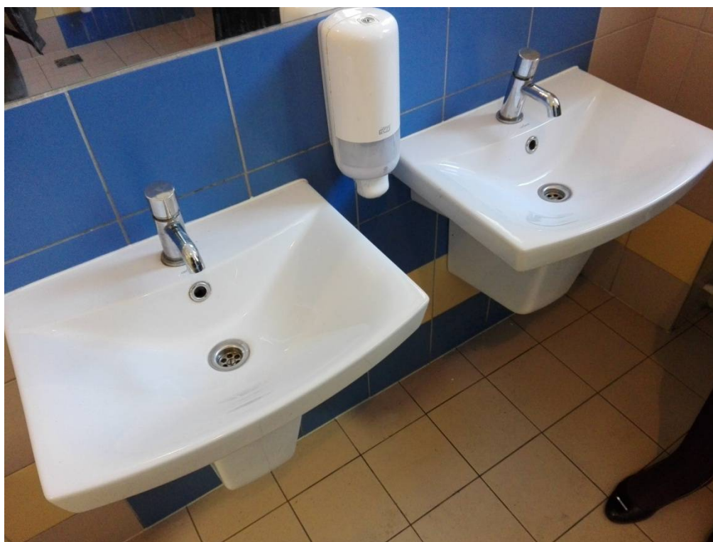
Widok umywalki i baterii czasowej