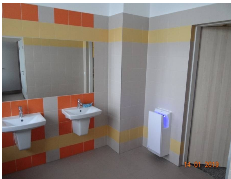
Widok umywalni jak w łazience na 3 piętrze