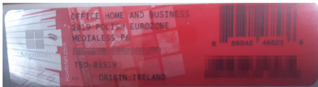
Rys. 2 przykładowy kod zabezpieczony przez producenta systemu Microsoft Windows Office Home&Business z wymazanym, znajdującym się w prawym dolnym rogu numerem seryjnym produktu. Kod licencyjny znajduje się w środku szczelnie zapakowanego i zafoliowanego pudełka (Rys. 3)