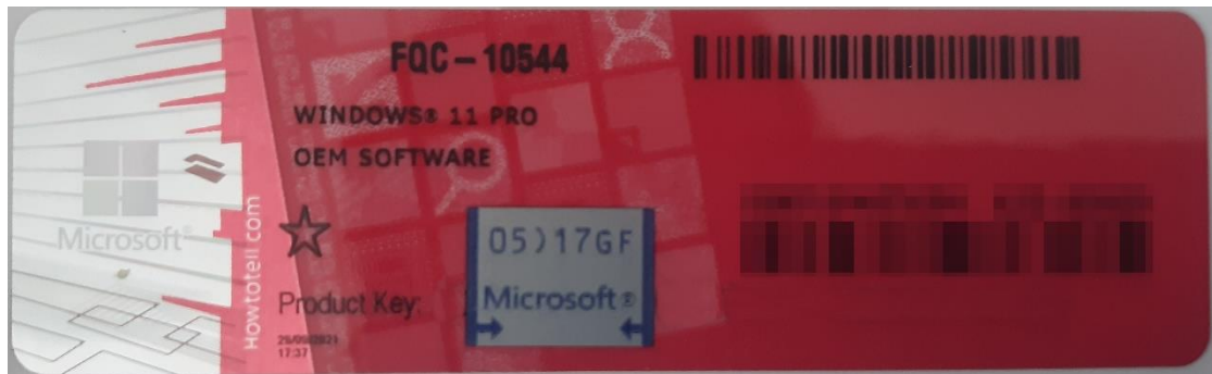
Rys. 1 przykładowy kod zabezpieczony przez producenta systemu Microsoft Windows 11 (takie same naklejki mają Windows 10) z wymazanym, znajdującym się przed i za szarą naklejką kodem licencyjnym

Poniższe zdjęcie obrazuje obecnie stosowane zabezpieczenia producenta firmy Microsoft (klucz systemu jest zabezpieczony naklejką hologramową przez producenta. Po jej zdrapaniu uzyskujemy dostęp do oryginalnego klucza):