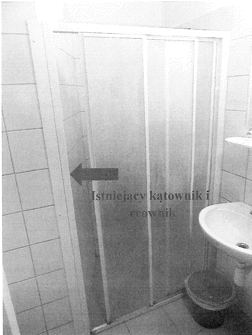
Fot.1. Stan istniejący