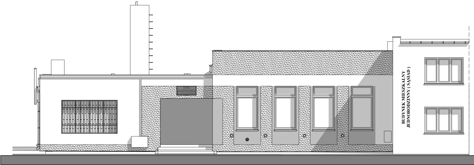
ELEWACJA FRONTOWA SKALA 1:100