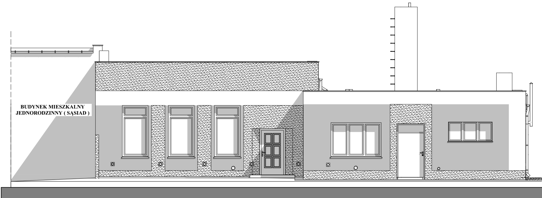
ELEWACJA TYLNA SKALA 1:100