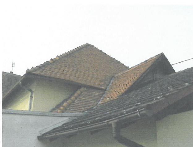
Widok na połacie dachowe na świetlicy od różnych stron