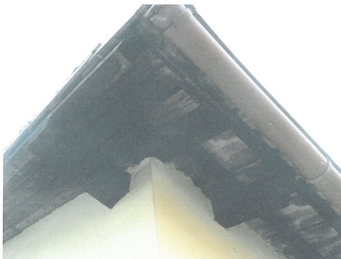
w części dachu współczesnej dobudówki

Istniejące podbitki z desek ocenić, ewentualnie wymienić na nowe, uzupełnić ubytki z desek gr.25mm. Nowe elementy wstępnie zaimpregnować preparatem FOBOS M-4. Całość przemaalować lakierobejcą w kolorze ciemny orzech.