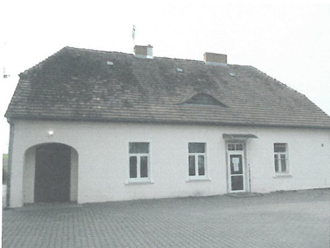
widok od strony podwórzowej