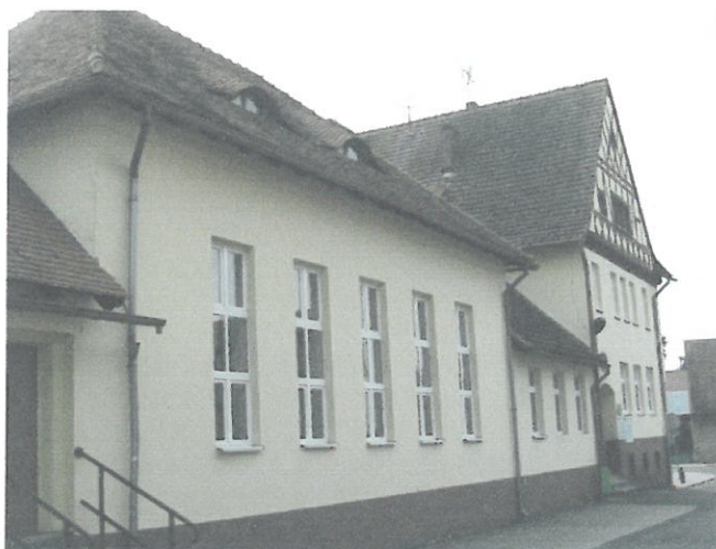
widok od strony elewacji frontowej

Przedmiotowy zakres prac remontowych pokrycia dachu nie ingeruje w inne elementy budynku.