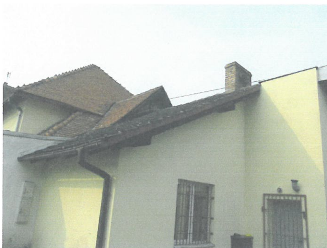
widok od strony elewacji szczytowej, dobudówki współczesnej