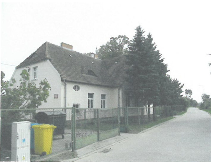
widok od strony elewacji frontowej

Przedmiotowy zakres prac remontowych pokrycia dachu nie ingeruje w inne elementy budynku.