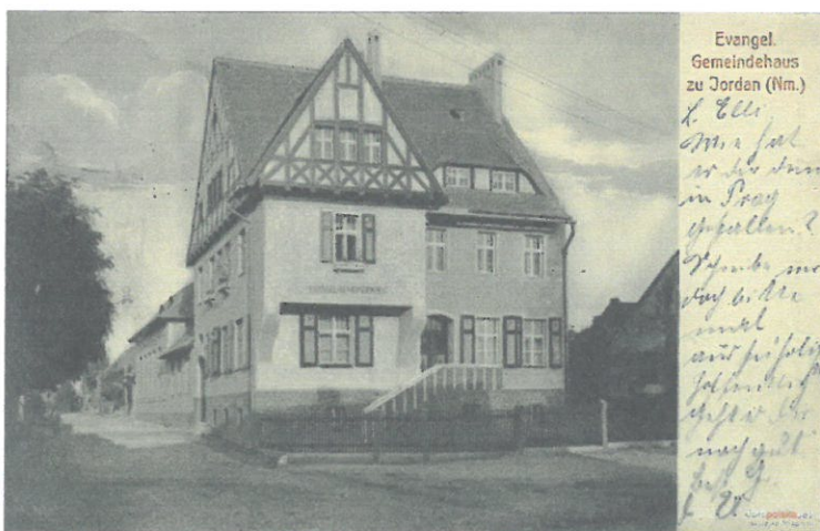
Pocztówka z 1913 roku przedstawiająca salę parafialną

Obiekt zlokalizowany na terenie wsi Jordanowo, zrealizowany przed 1939 rokiem.