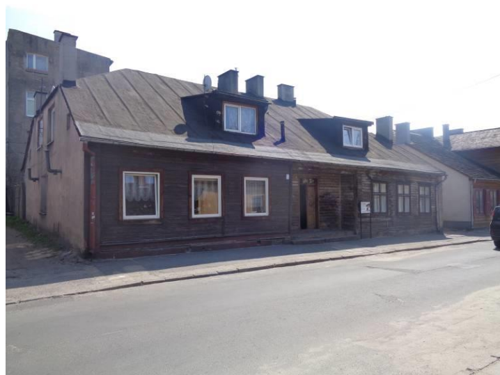
Zdjęcie 17. Budynek mieszkalny ul. Narutowicza 27.