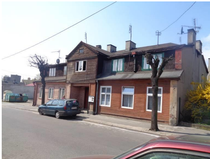
Zdjęcie 18. Budynek mieszkalny ul. Narutowicza 28.