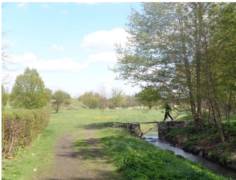
Zdjęcie 3. Ciąg spacerowy parku, w perspektywie wzniesienie możliwe do wykorzystania do rekreacji.

Przedmiotowy teren parku położony jest na wschód od ul. Barlickiego wzdłuż rzeki Bzury. Wschodnią granicę obszaru zielonego stanowi linia władania GMZ a od północy ograniczony jest ul. Obrońców Pokoju. Obecnie obszar ten jest nieurządzonym terenem zielonym, który mimo interesującego położenia, tylko częściowo wykorzystywany jest w celach rekreacyjnych.