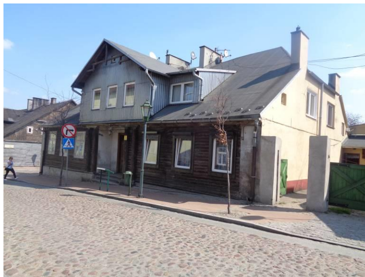
Zdjęcie 10. Budynek mieszkalny ul. Narutowicza 7.