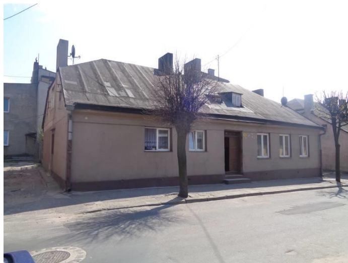
Zdjęcie 16. Budynek mieszkalny ul. Narutowicza 25.