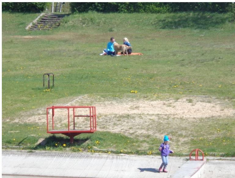
Zdjęcie 5. OW Malinka – teren plaży przy basenach kąpielowych.