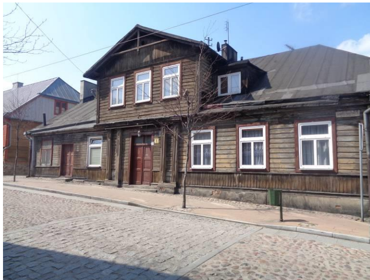
Zdjęcie 8. Budynek mieszkalny ul. Narutowicza 4.