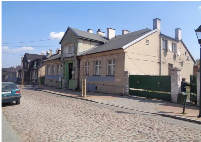
Zdjęcie 14. Budynek mieszkalny ul. Narutowicza 15.