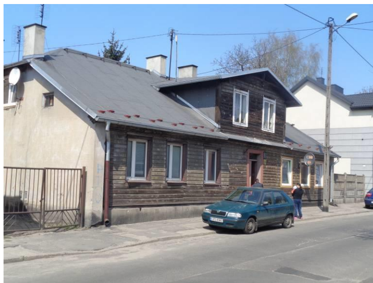
Zdjęcie 15. Budynek mieszkalny ul. Narutowicza 20.