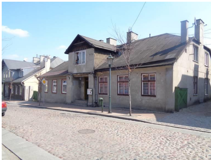
Zdjęcie 11. Budynek mieszkalny ul. Narutowicza 9.