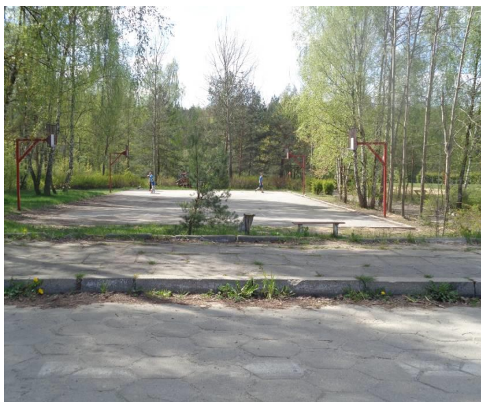
Zdjęcie 6. OW Malinka – teren boisk.