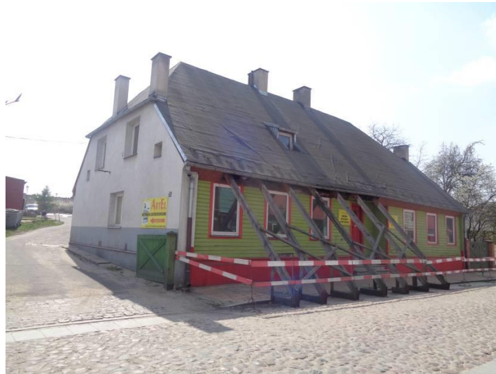
Zdjęcie 1. Elewacja frontowa budynku ul. Rembowskiego 2.

Budynek położony na terenie „Miasta Tkaczy”, wyłączony z użytkowania po wybuchu gazu. Należy odrestaurować budynek przywracając mu pełnioną dotąd funkcję mieszkalną z dostosowaniem do aktualnie obowiązujących wymagań funkcjonalno - konstrukcyjnych.