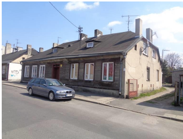
Zdjęcie 19. Budynek mieszkalny ul. Narutowicza 35.