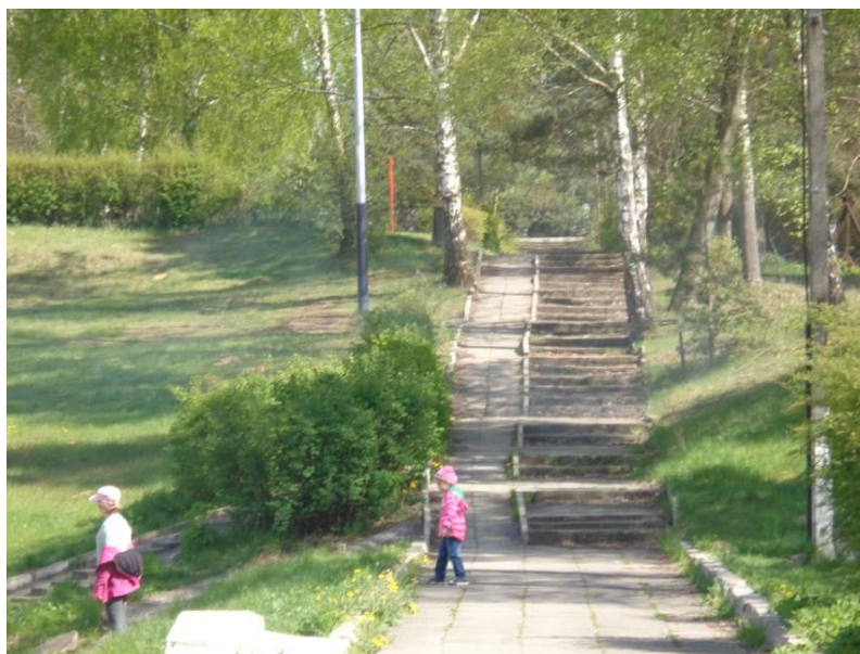
Zdjęcie 4. OW Malinka – schody terenowe prowadzące do boisk sportowych.

Teren ośrodka jest położony na stoku góry Wilamowskiej, w otoczeniu lasów. U jej stóp wydzielone są akweny wodne - kąpielisko o zdegradowanym podłożu betonowym z brodzikiem dla dzieci - w sezonie letnim z obsługą ratowników - oraz staw do rekreacji na wodzie.