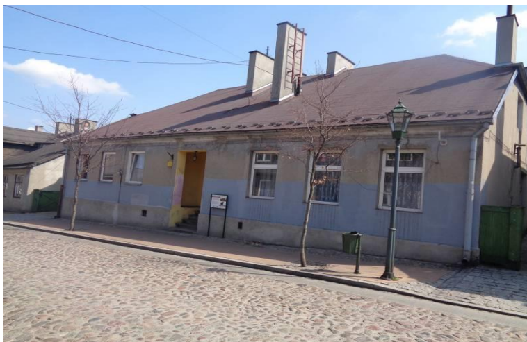
Zdjęcie 12. Budynek mieszkalny ul. Narutowicza 11.