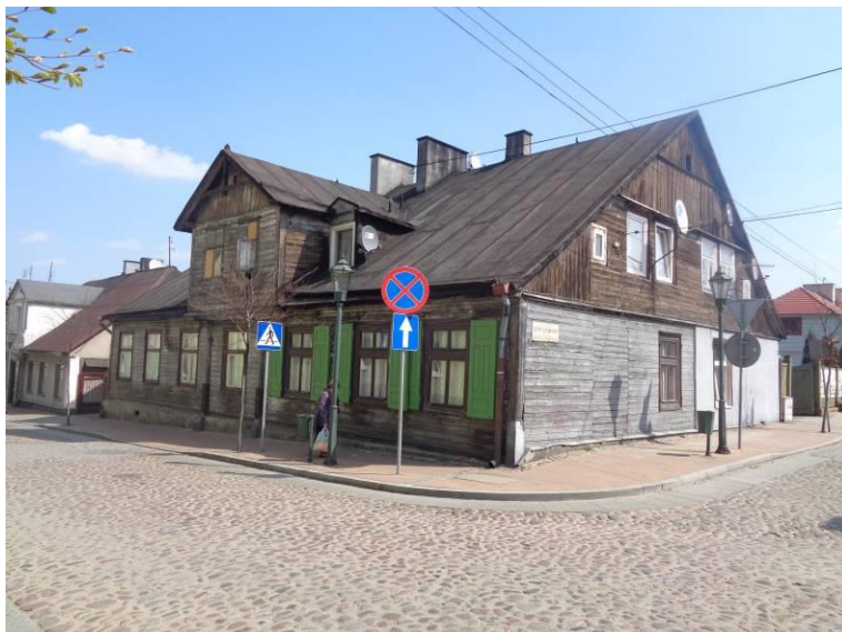
Zdjęcie 9. Budynek mieszkalny ul. Narutowicza 5.