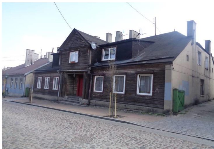
Zdjęcie 13. Budynek mieszkalny ul. Narutowicza 13.