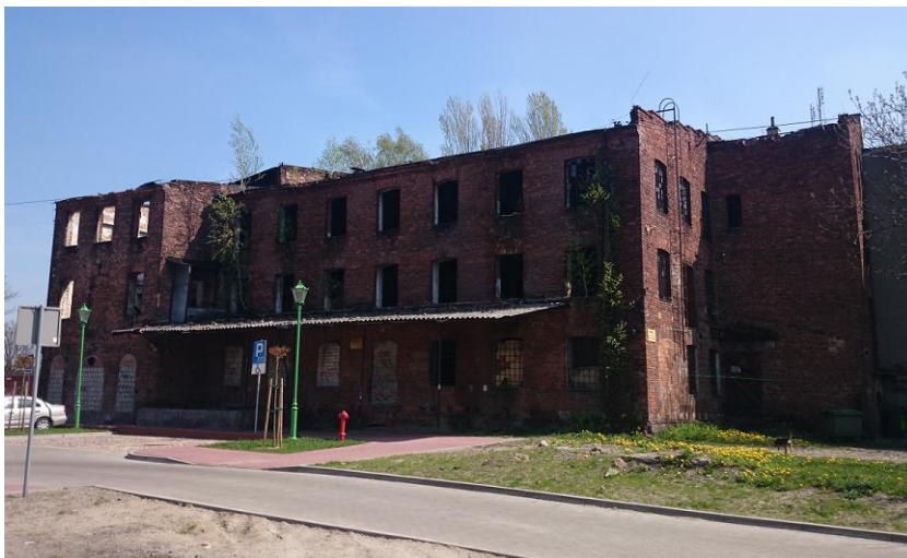
Zdjęcie 7. Stary Młyn – widok z ul. Narutowicza

Obecnie budynek jest wyłączony z użytkowania.