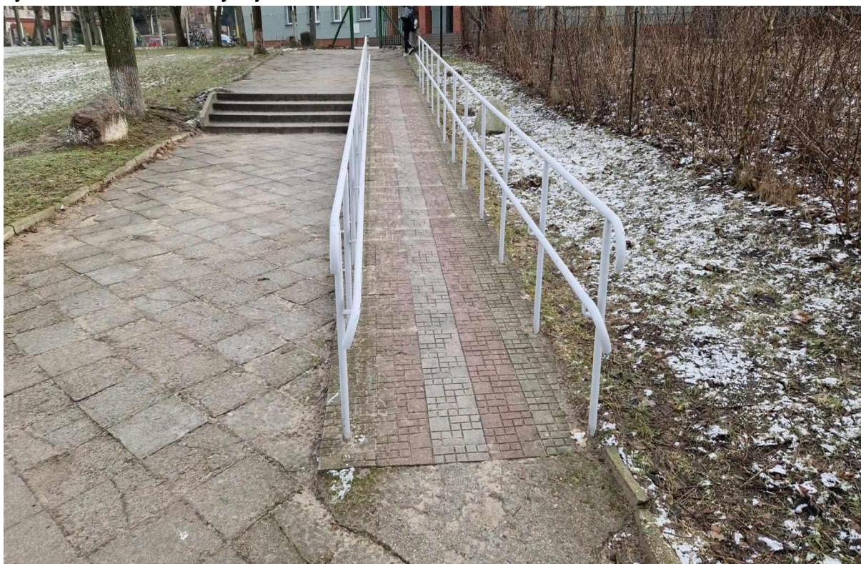
Rys. 2 Alejka komunikacyjna z pochylnią dla niepełnosprawnych