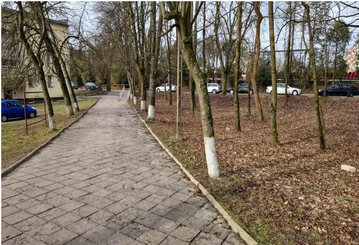
Rys. 10 Widok na alejkę i połączenie z ul. Kętrzyńskiego