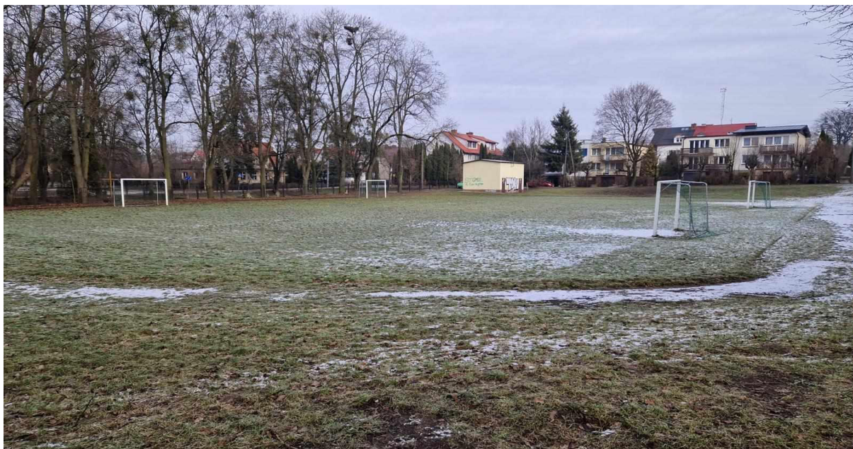
Rys. 1 Widok boiska od strony alejki.