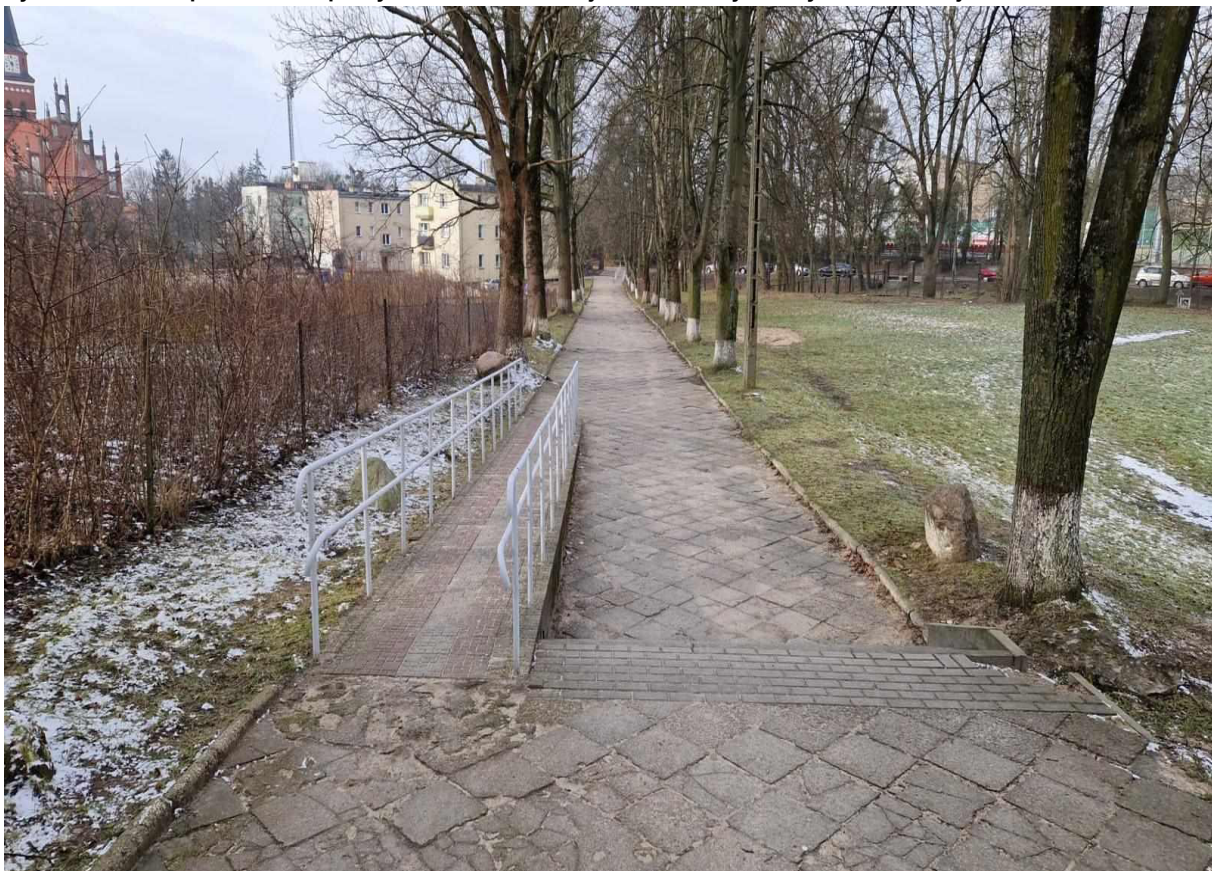
Rys. 16 Zejście z pochylni od strony Szkoły Podstawowej