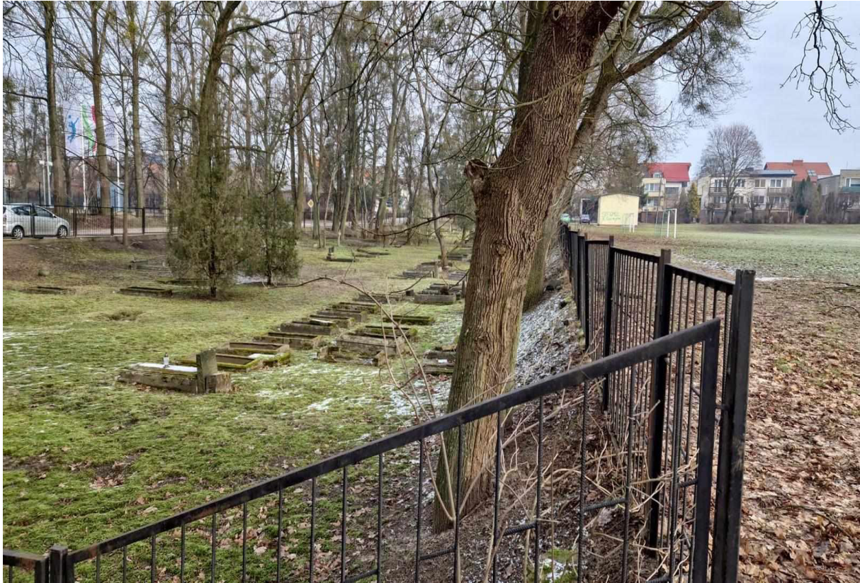
Rys. 5 Starodrzew i cmentarz graniczący z boiskiem