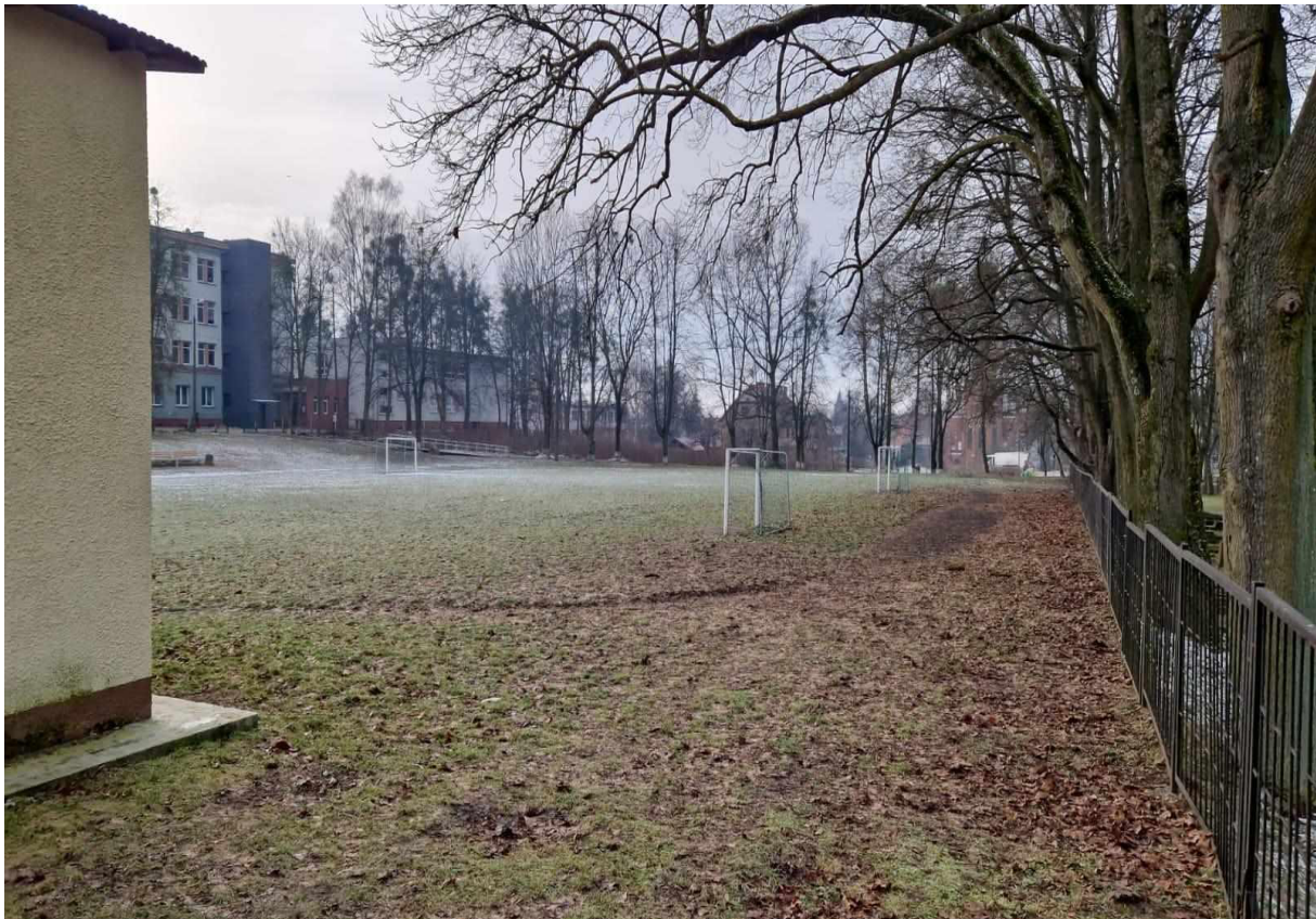
Rys. 13 Widok na stację trafo, ogrodzenie cmentarza od strony ul. Asnyka