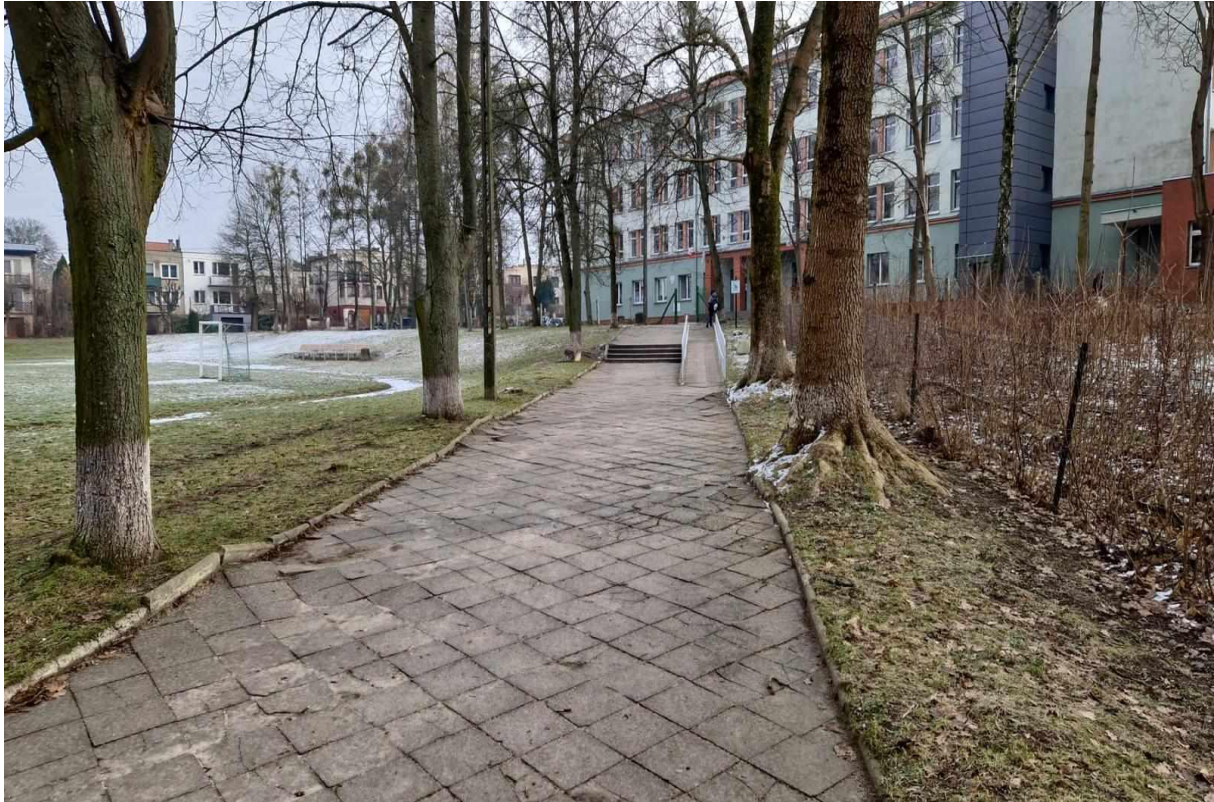
Rys. 11 Widok na alejkę, pochylnię i Szkołę Podstawową