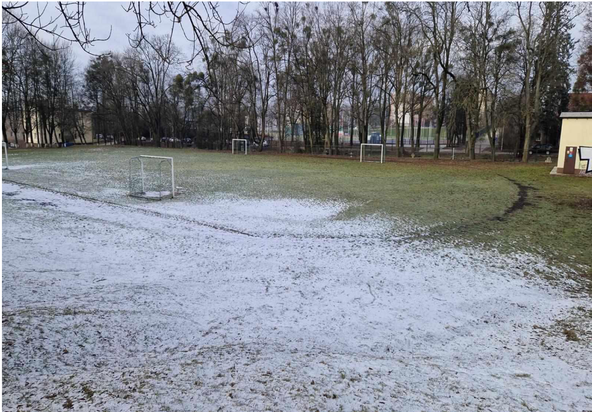
Rys. 6 Widok na boisko od strony Szkoły Podstawowej