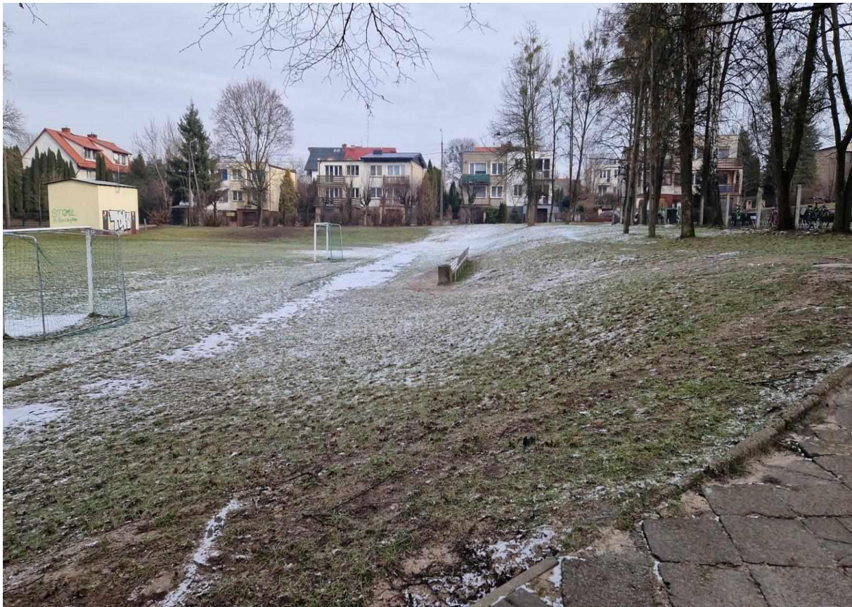
Rys. 15 Widok na pozostałości po trybunach boiska – zejście od strony Szkoły Podstawowej