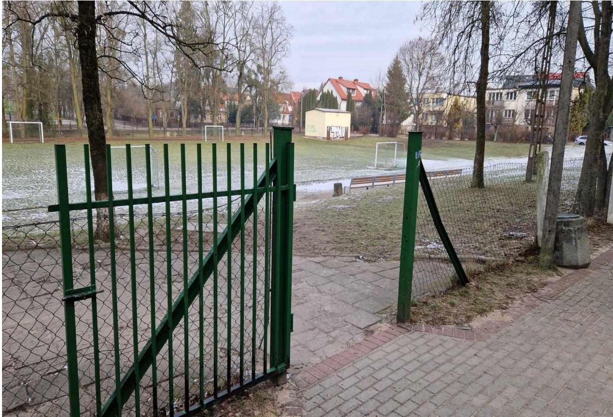
Rys. 7 Widok na boisko od strony Szkoły Podstawowej