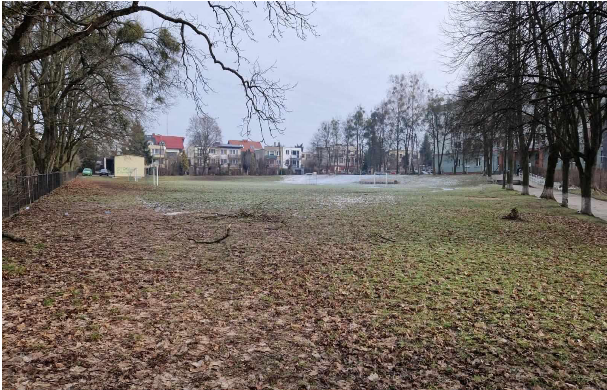
Rys. 9 Widok ogólny