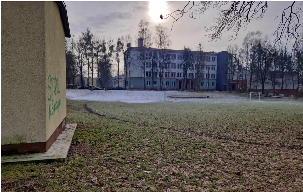
Rys. 4 Widok boiska od strony ul. Asnyka