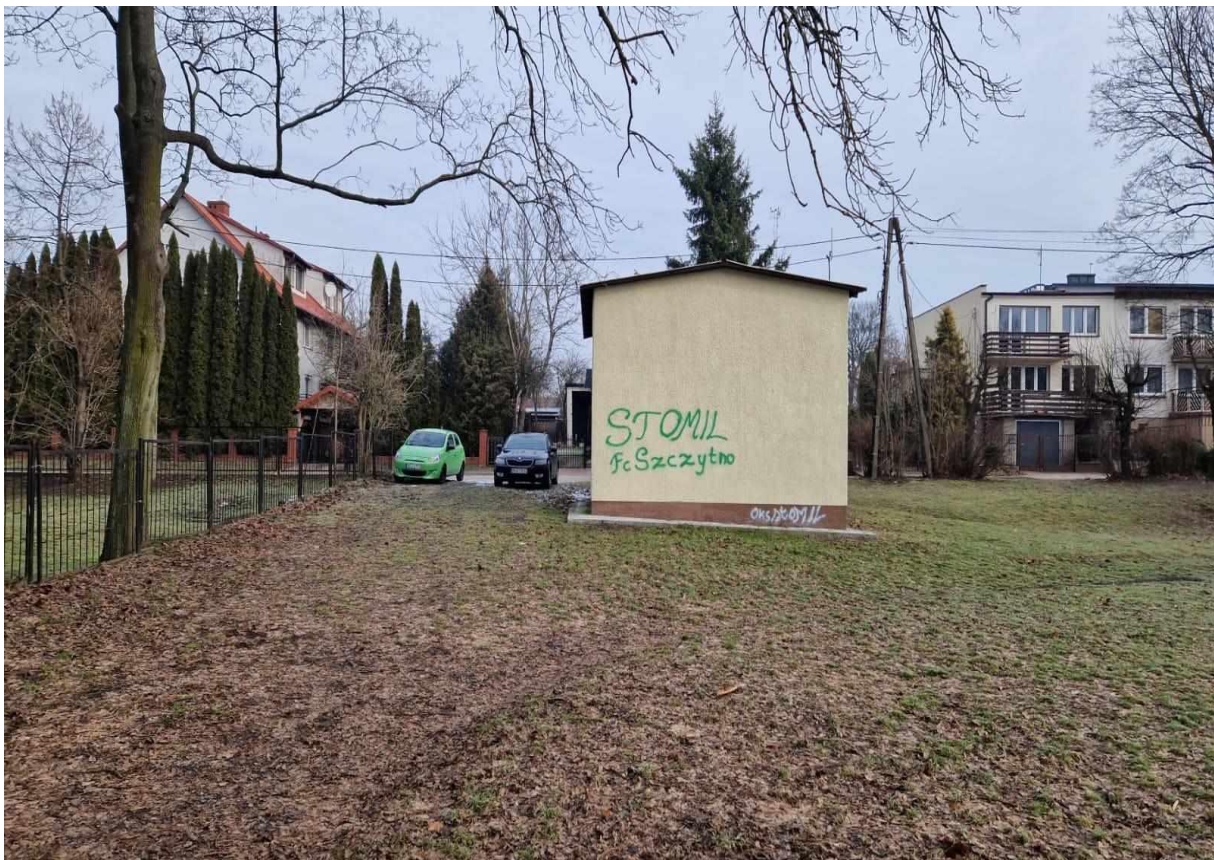
Rys. 12 Stacja transformatorowa