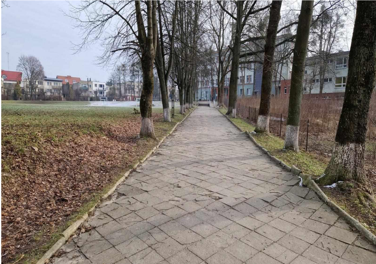
Rys. 3 Widok całej alejki komunikacyjnej od ul. Kętrzyńskiego