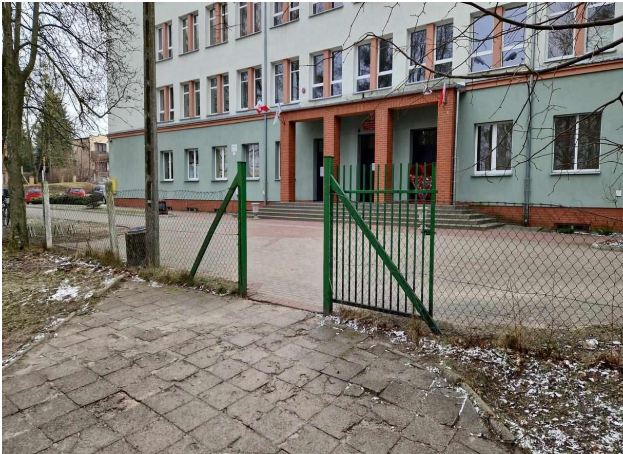
Rys. 8 Wejście główne do Szkoły Podstawowej