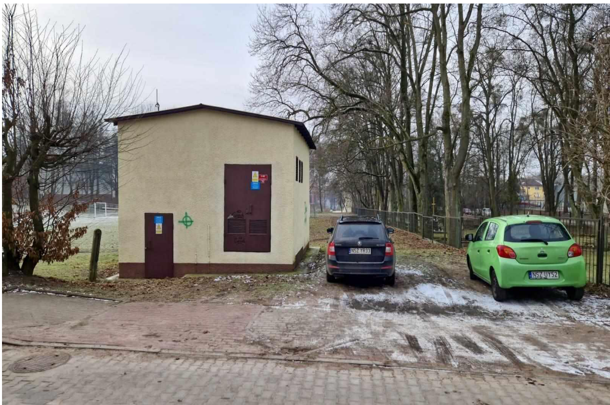
Rys. 14 Zjazd z ul. Asnyka na teren boiska, stacja trafo