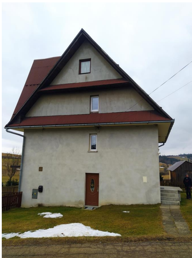
widok od strony NE