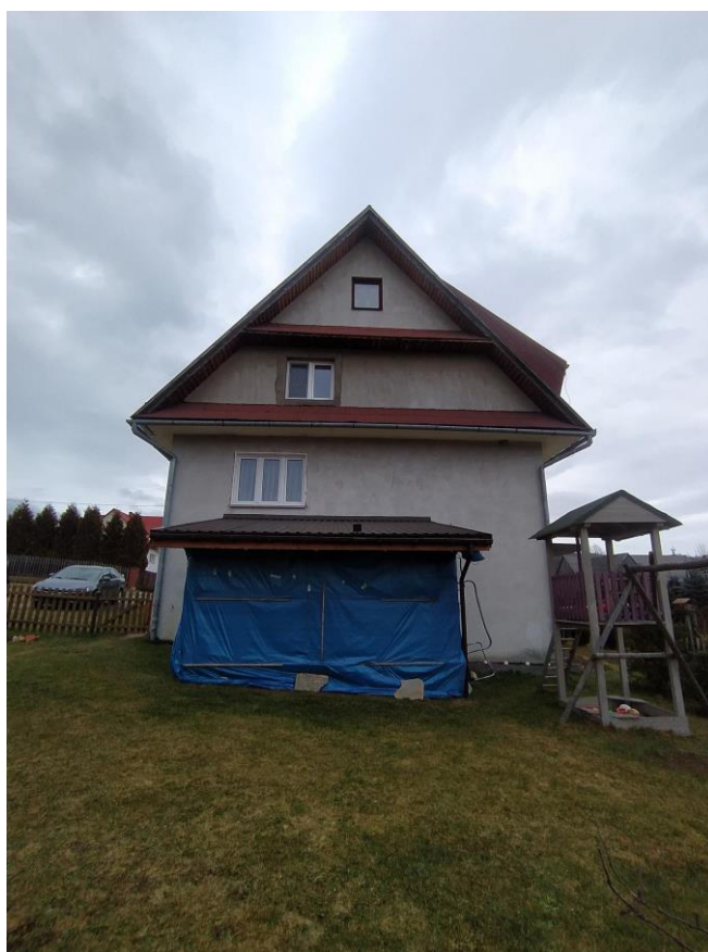
widok od strony SW