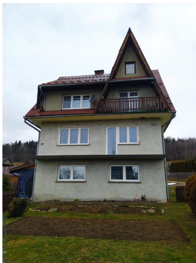
widok od strony SE