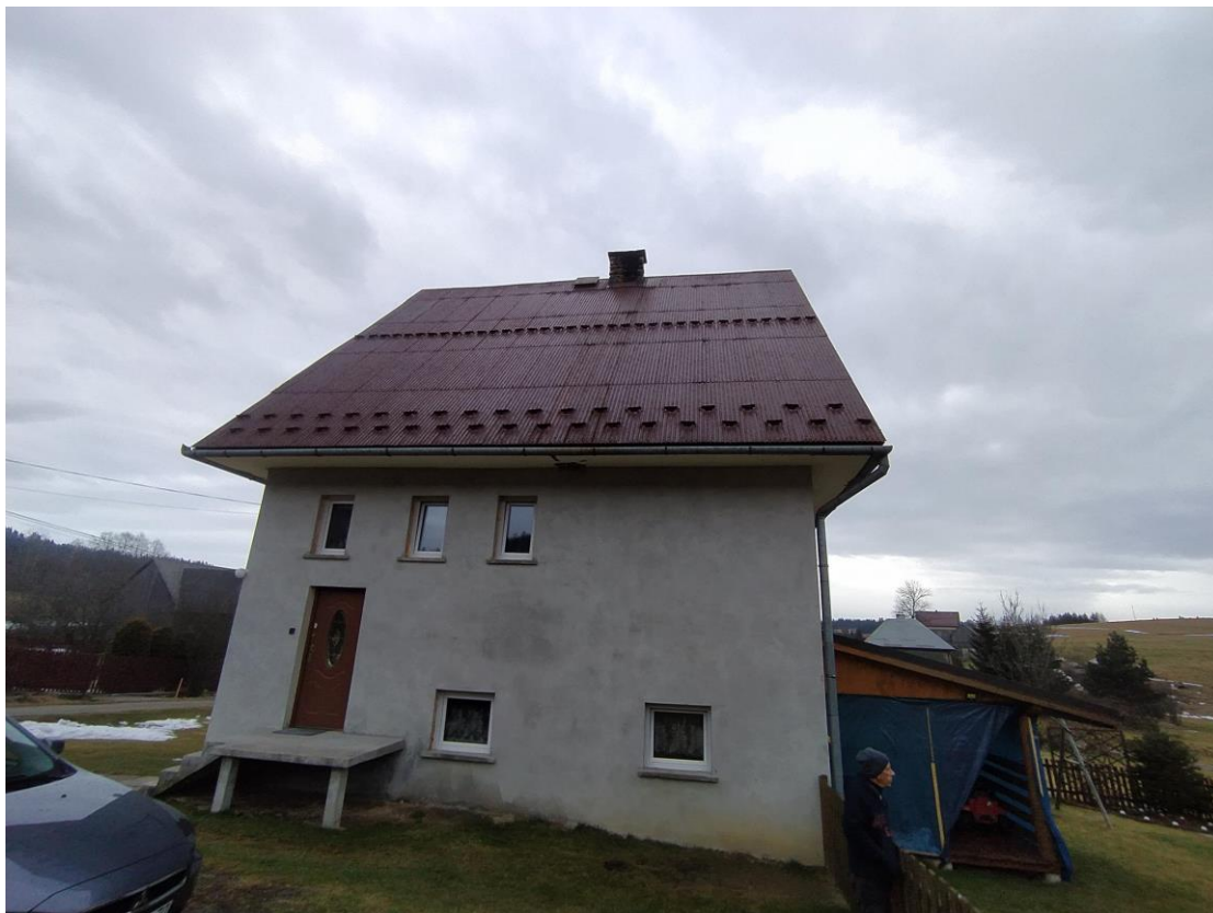
widok od strony NW