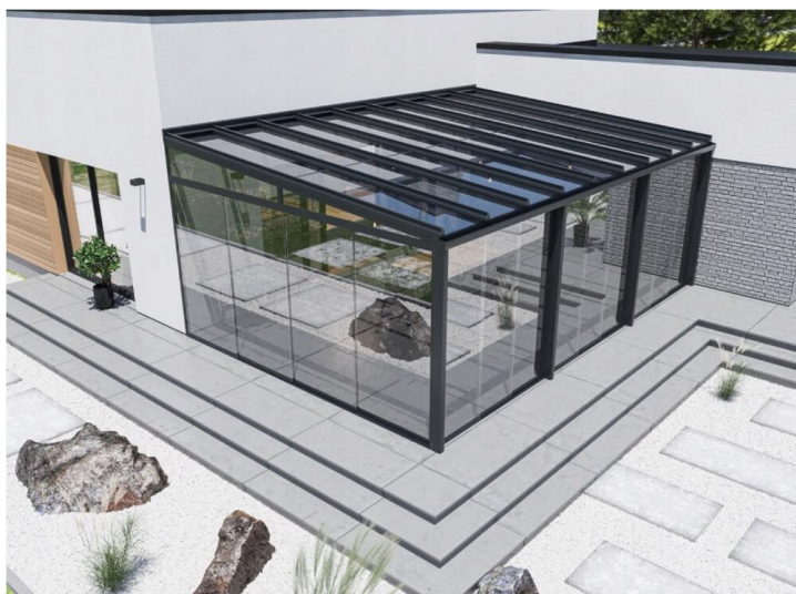
Poglądowy oczekiwany wygląd oranżerii.