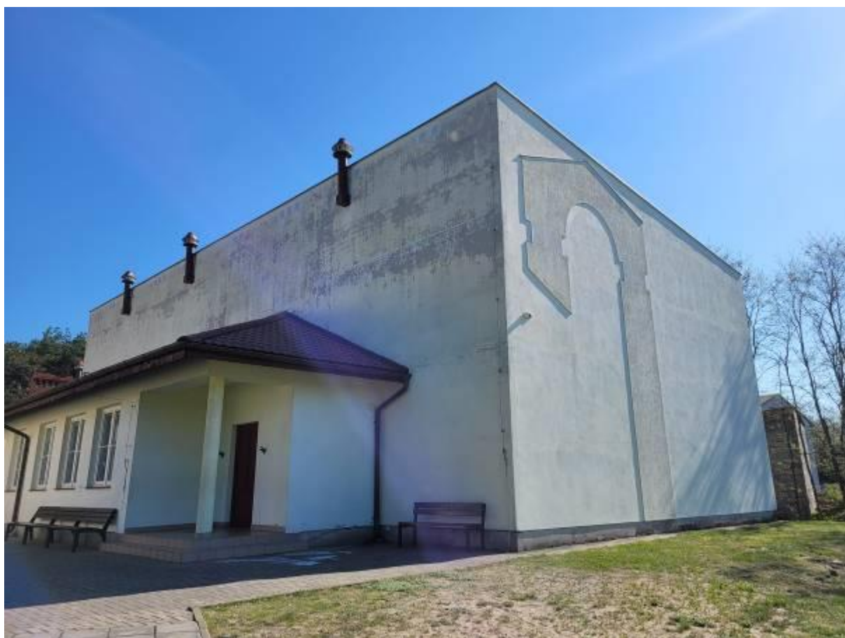
Przebudowa budynku Szkoły Podstawowej w Ostrówku