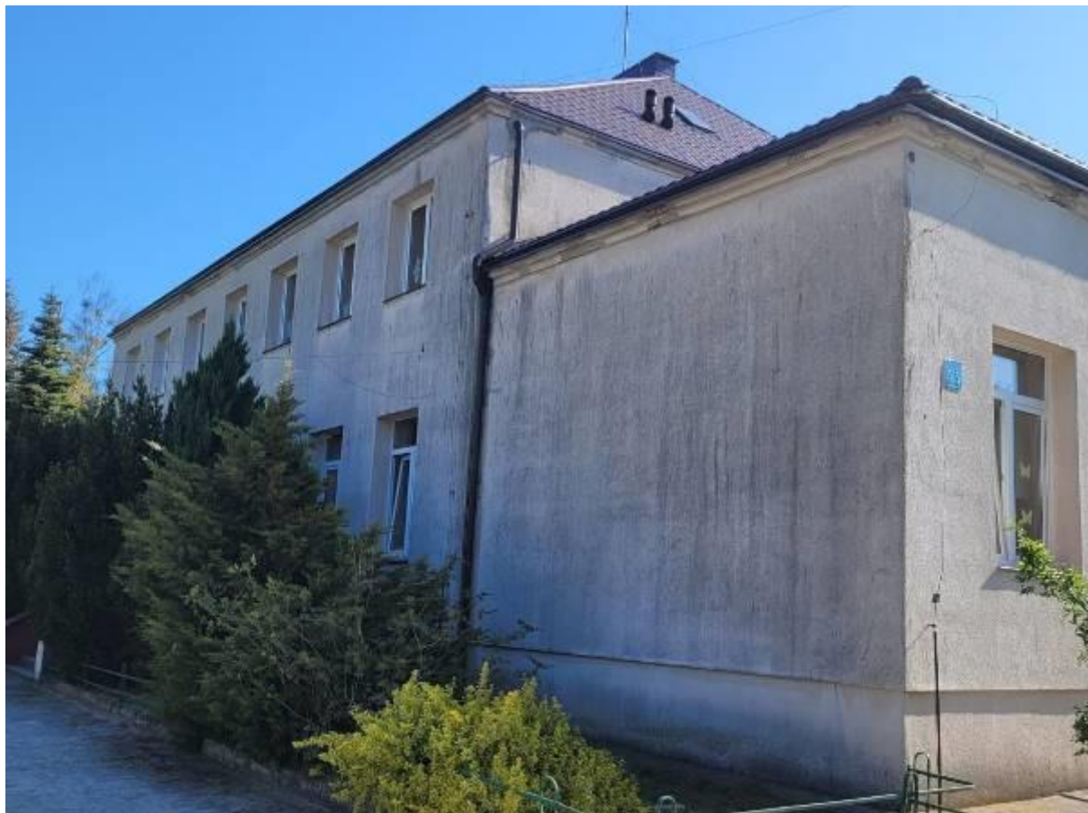
Przebudowa budynku Szkoły Podstawowej w Ostrówku