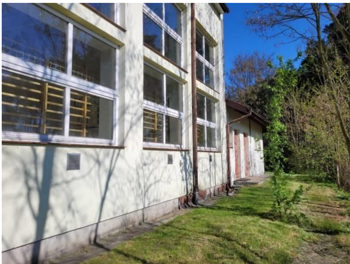
Przebudowa budynku Szkoły Podstawowej w Ostrówku