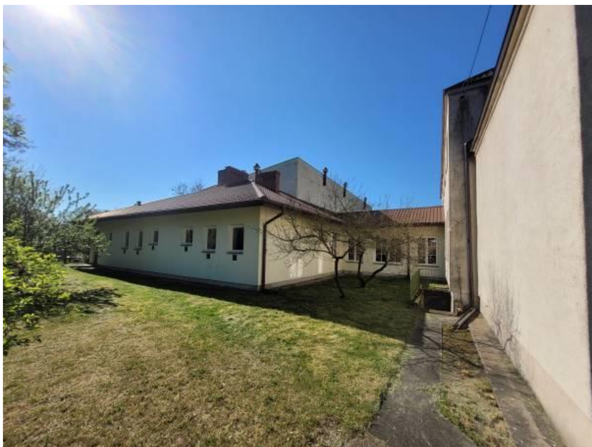
Przebudowa budynku Szkoły Podstawowej w Ostrówku