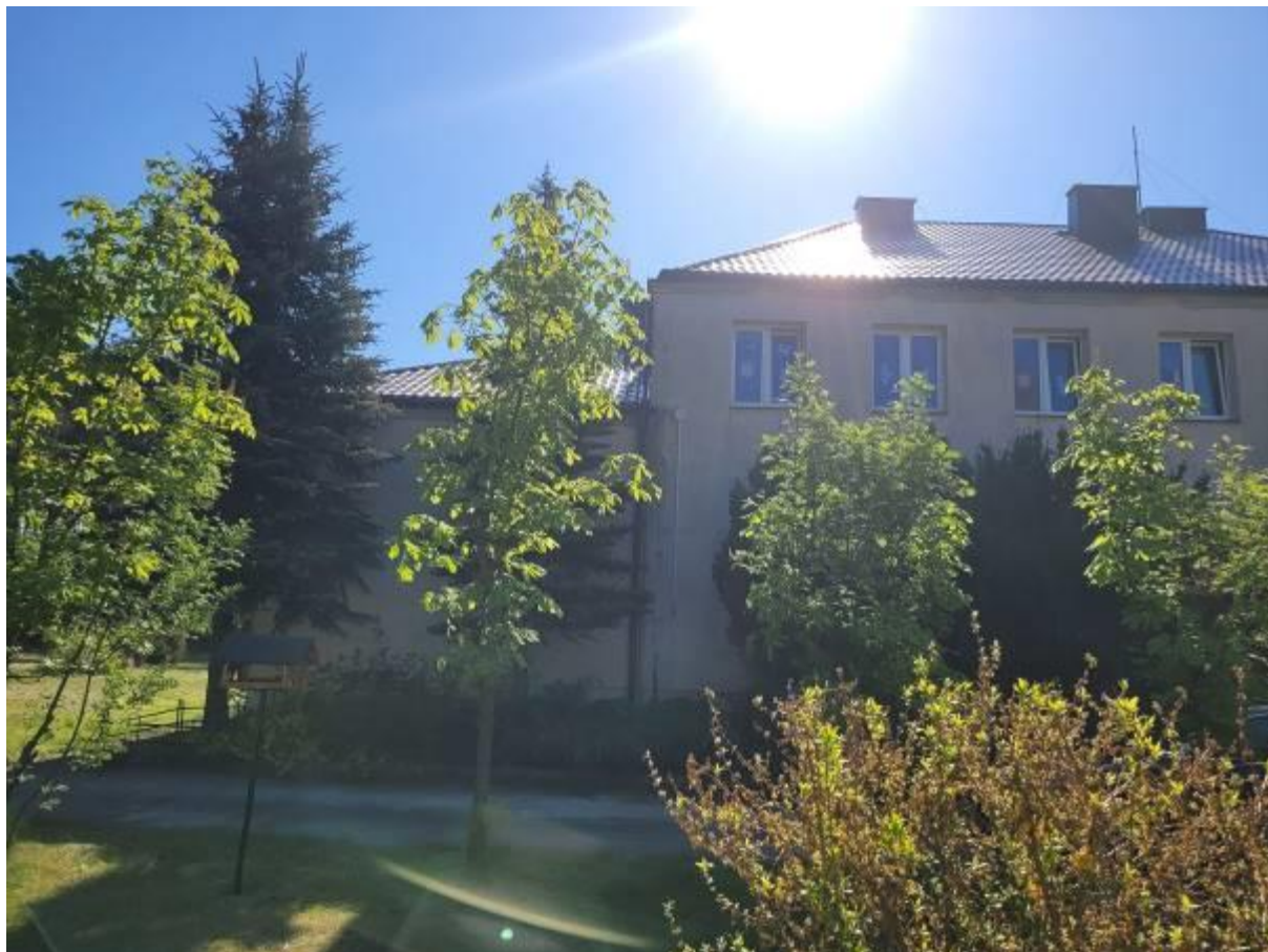
Przebudowa budynku Szkoły Podstawowej w Ostrówku