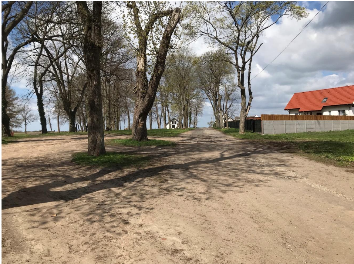
Rys. 2 Stan istniejący