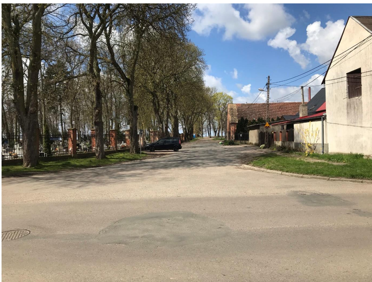
Rys. 1 Stan istniejący

Ze względu na istniejącą nawierzchnię drogę można podzielić na cztery odcinki. Odcinek pierwszy od skrzyżowania z ul. Cmentarną do posesji nr 4 nawierzchnia z mieszanki mineralno-asfaltowej. Odcinek drugi od wjazdu na posesje nr 4 do granicy dz. ewid. nr 191 i 126/2 destrukta (przekrusz) asfaltowy wymieszany z kruszywem. Odcinek trzeci od granicy dz. ewid. nr 191 i 126/2 do wjazdu na posesje nr 6 nawierzchnia z kostki kamiennej (pas od strony cmentarza) oraz kruszywa łamanego (pas przeciwny). A odcinek czwarty od wjazdu na posesje nr 6 do końca opracowania to nawierzchnia zbudowana z gruzu z domieszka kamieni.