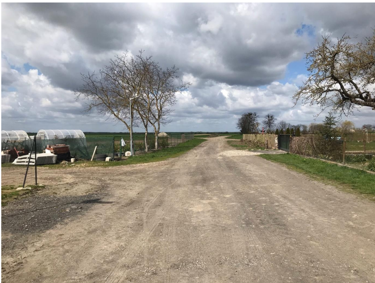
Rys. 4 Stan istniejący