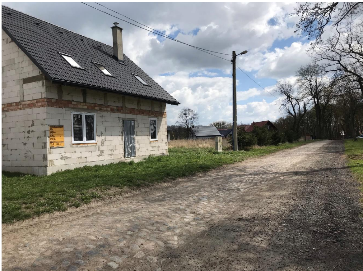
Rys. 3 Stan istniejący