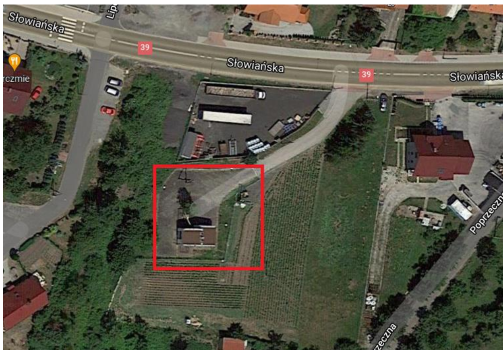
Rys. 2. Zagospodarowanie terenu przepompowni ścieków przy ulicy Słowiańskiej.

Stan techniczny wszystkich obiektów oczyszczalni jest niedostateczny.