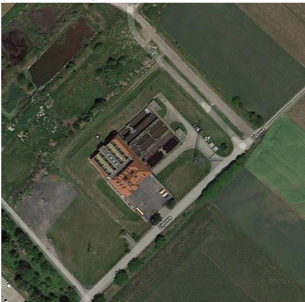
Rys. 1. Zagospodarowanie terenu oczyszczalni ścieków

Aktualny stan zagospodarowania terenu inwestycji (oczyszczalni ścieków) przedstawiono na zdjęciu poniżej.