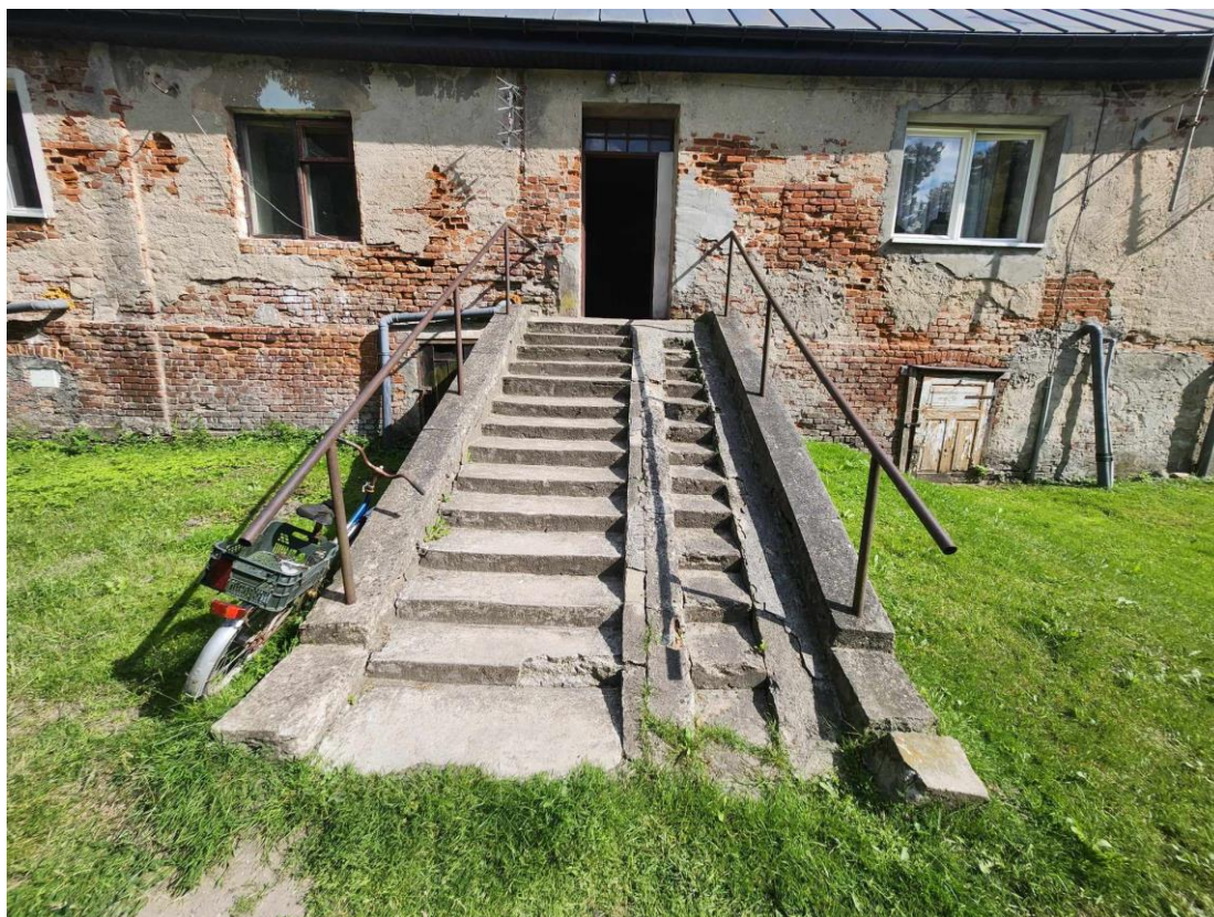
Widok schodów tyłu budynku