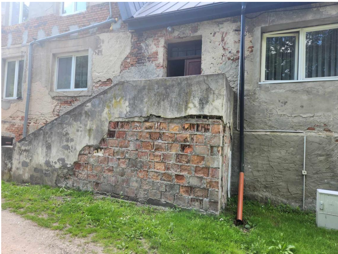
Widok schodów od frontu budynku