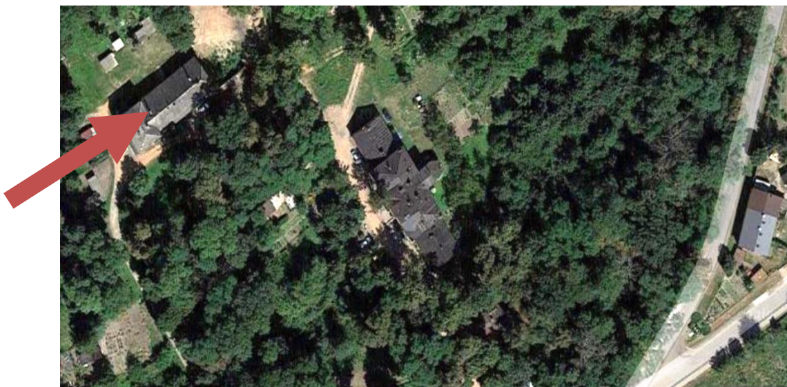
Zdjęcie 1.1 Lokalizacja budynku komunalnego w miejscowości Osiecz Wielki [ https://www.google.pl/maps ]

Lokalizację inwestycji przedstawiono na zdj. nr 1.1 [ https://www.google.pl/maps ] oraz na mapie zasadniczej stanowiącej załącznik do niniejszego opracowania.