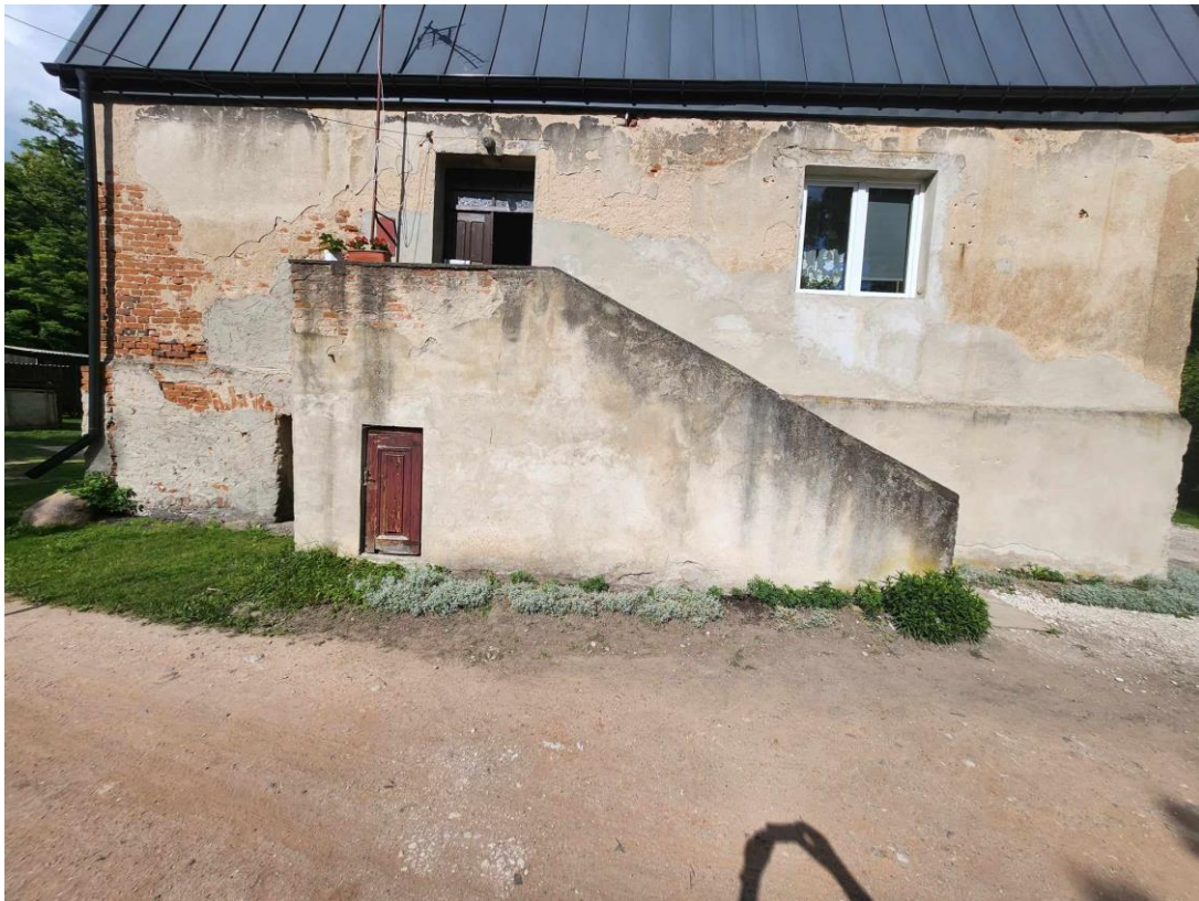
Widok schodów szczytowych budynku