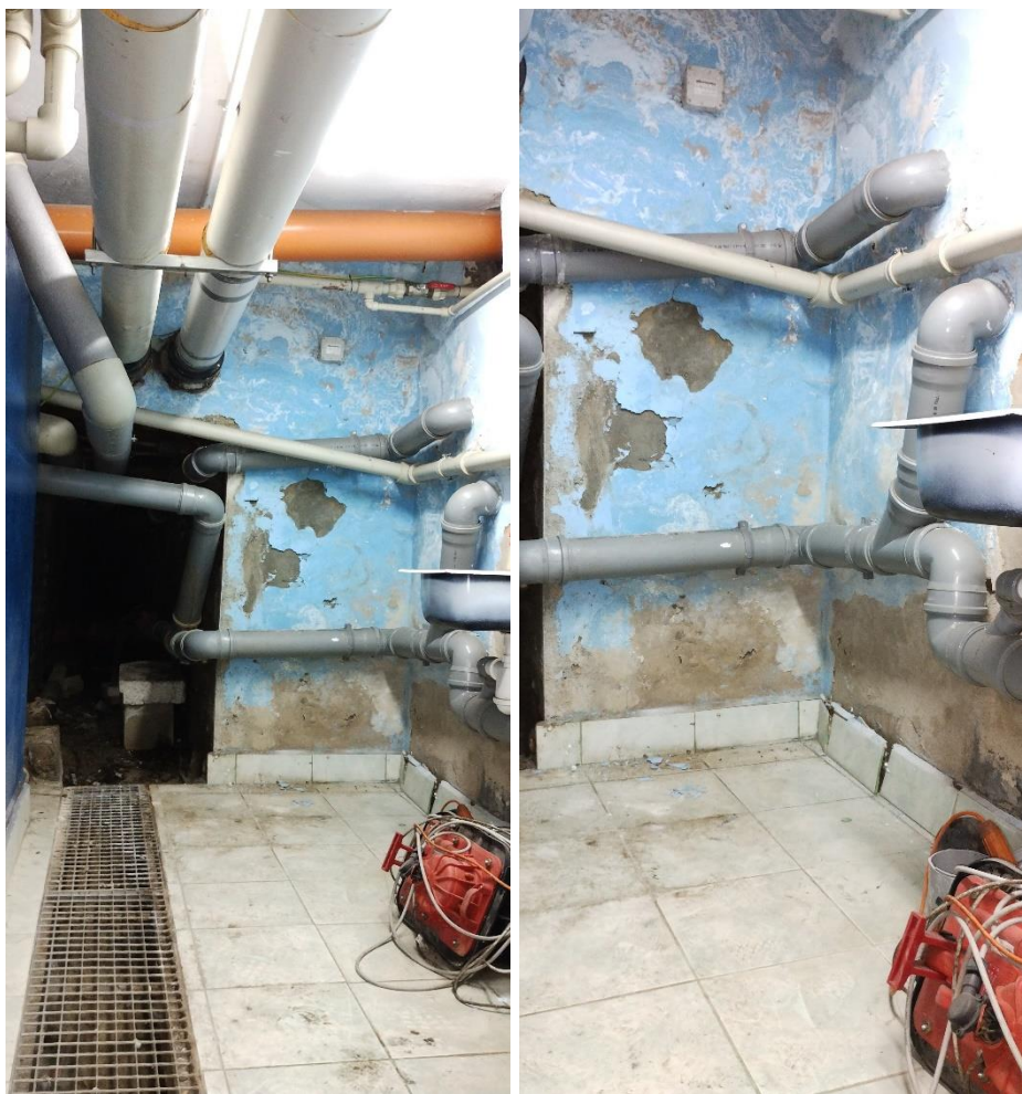
Stan istniejący, przykład

Wykonanie w formule „zaprojektuj i wybuduj” robót remontowych izolacji przeciwwodnej ścian piwnicznych w Laboratorium Pojazdów w Gmachu Samochodów i ciągników Politechniki Warszawskiej w Warszawie przy ul. Narbutta 84.