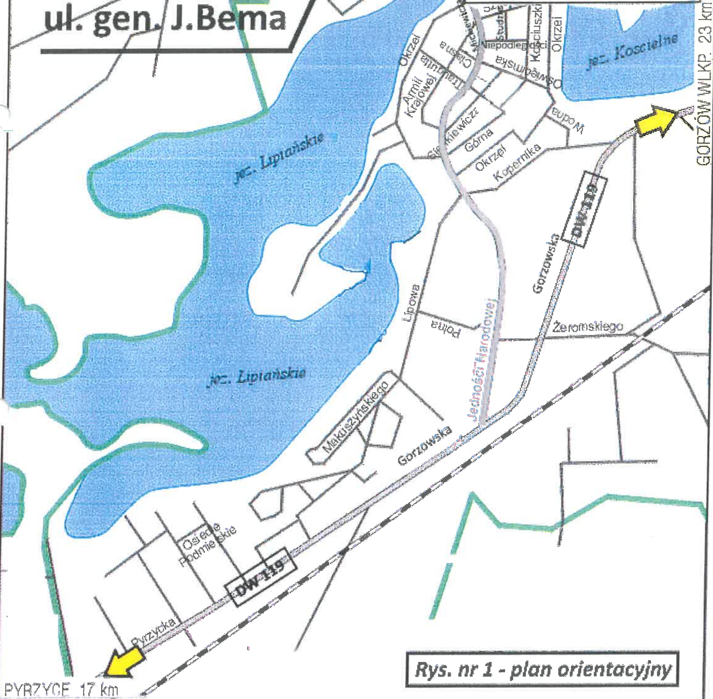
Rys. nr 1 - plan orientacyjny

PROJEKT TYMCZASOWEJ ORGANIZACJI RUCHU I ZABEZPIECZENIA ROBÓT -budowa chodnika w pasie drogi gminnej - ul. gen. J. Bema w Lipianach inwestor: Gmina Lipiany